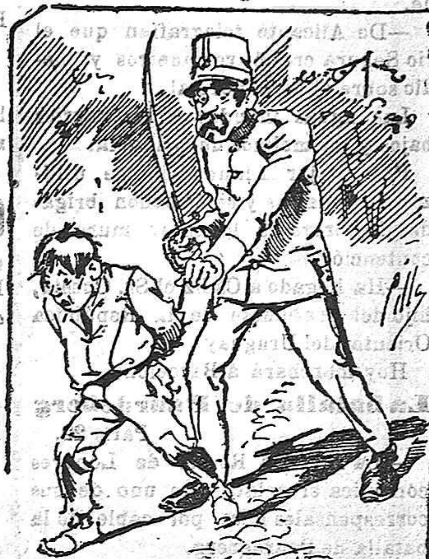
Tratamientos de la policía á nuestros vendedores cuando el número pica....