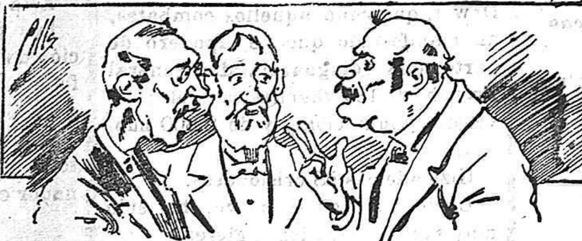
Abominan á nuestros libros....., pero los compran.

Todas las personas de gusto, curiosas é ilustradas deben pedir al Director de LA AVISPA, apartado núm. 8, MADRID, un ejemplar que se remite gratis y franqueado. Esta Revista Enciclopédica Popular publica recreaciones científicas, recetas de cocina, repostería, confitería, vinos, licores, pinturas, barnices, betunes y fórmulas para toda clase de industria, y cuantas noticias y conocimientos puedan ser beneficiosos. Cuenta además con buenos grabados, parte literaria excelente; da regalos mensuales á sus lectores con la Lotería Nacional y participaciones en la misma, á cuyo efecto compra todos los sorteos, y en una de las Administraciones más afortunadas por la suerte, billetes enteros. La suscripción y los números que se nos pidan se sirven gratuitamente á correo vuelto y franqueados, con sólo indicar el nombre y dirección del que lo desea en sobre dirigido al Sr. Administrador de