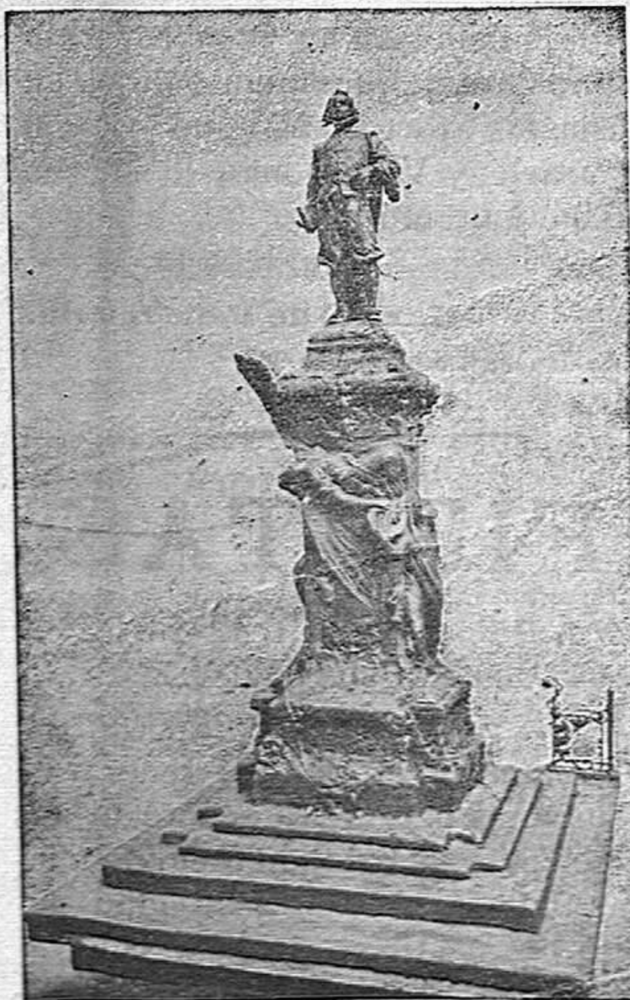
Monumento á Quevedo OBRA DE QUEROL