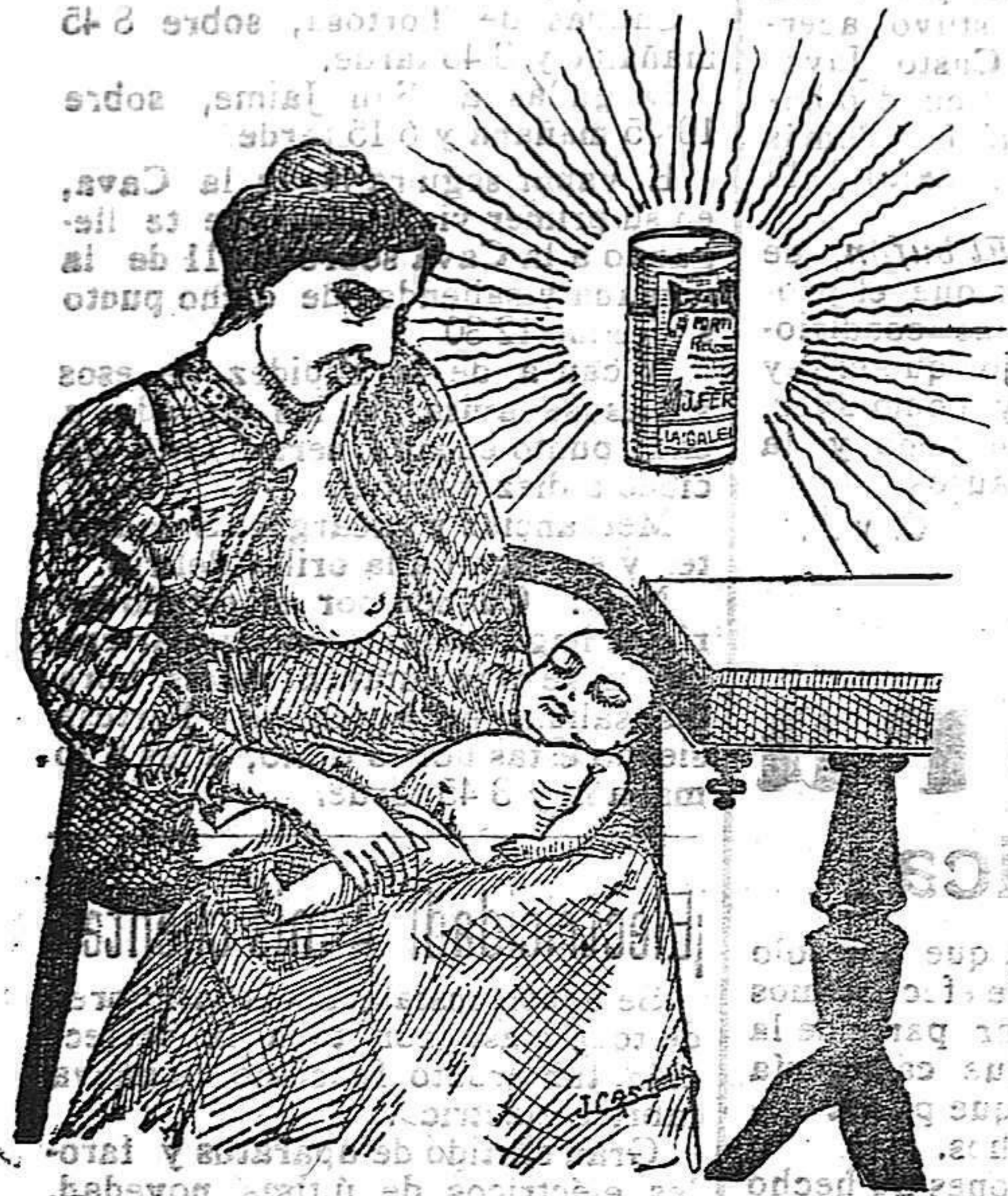
La que hizo caso del Salverol

Depósito general S. A. del Salverol en Santa Bárbara (Tarragona)