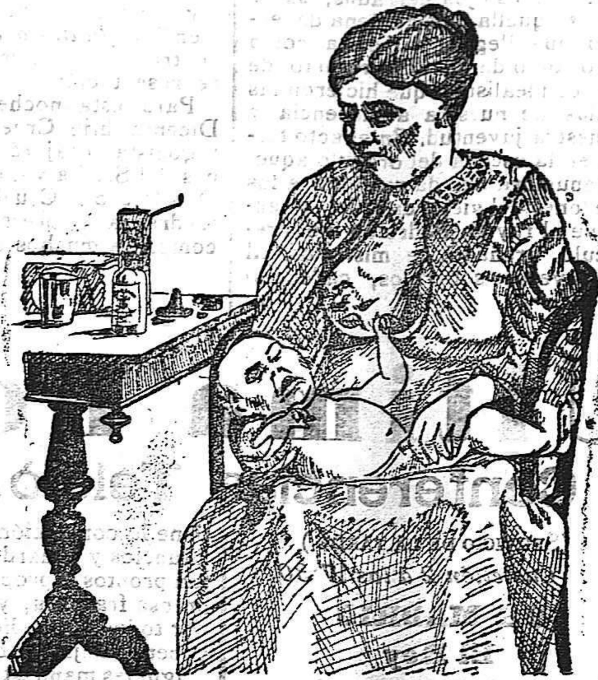
La que no hizo caso del Salverol