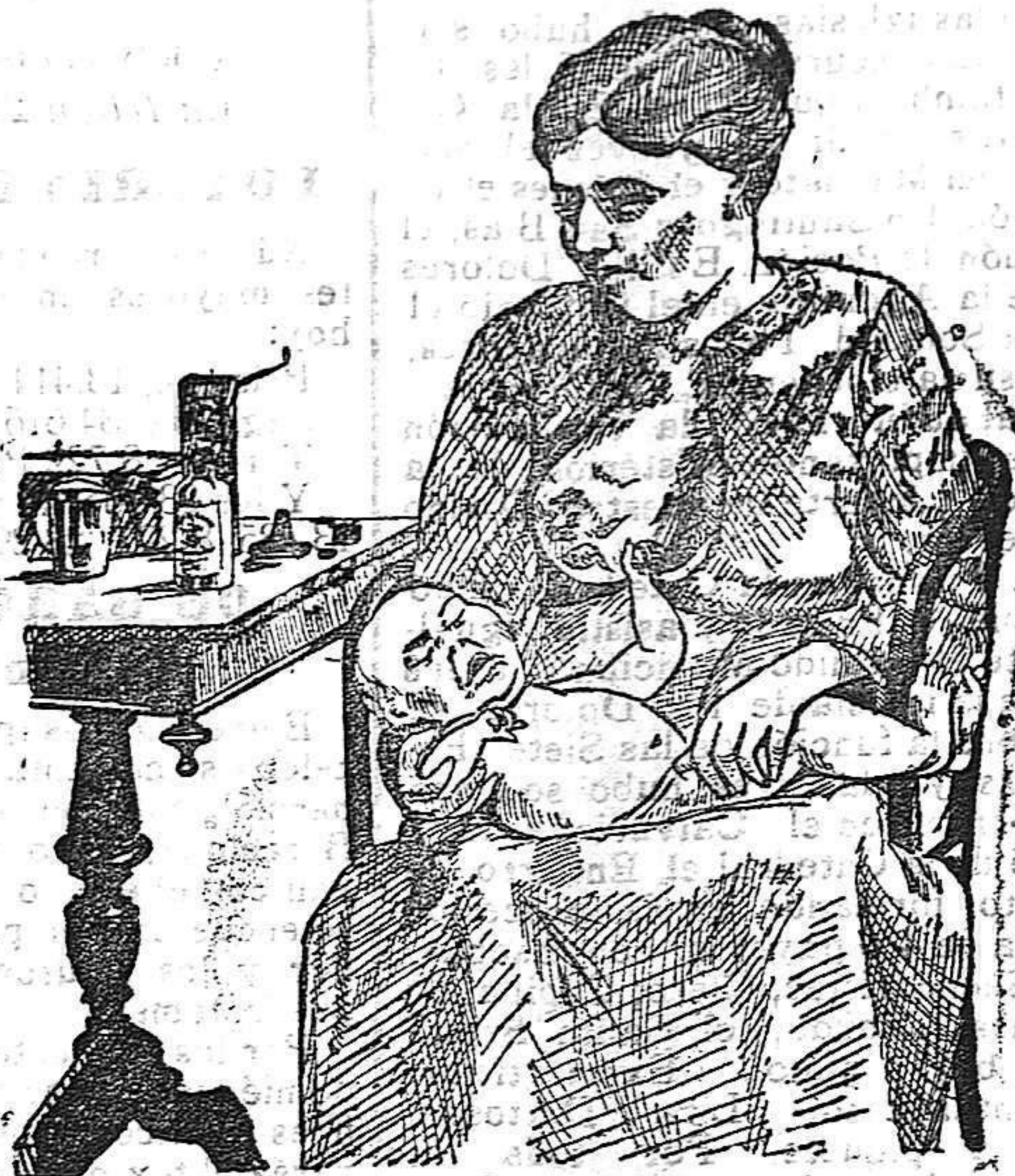
La que no hizo caso del Salverol