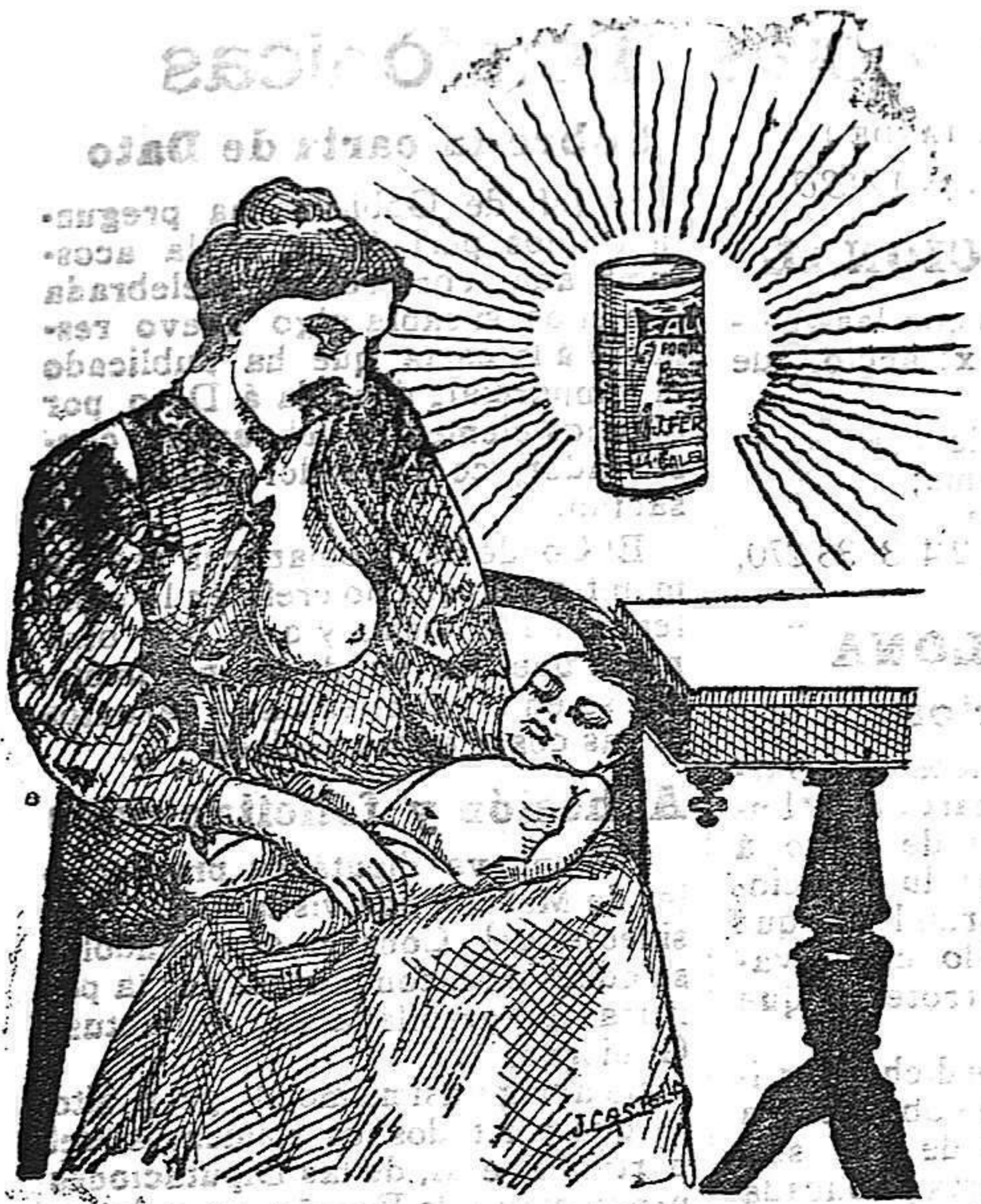
La que hizo caso del Salverol

Depósito general S. A. del Salverol en Santa Bárbara (Tarragona)