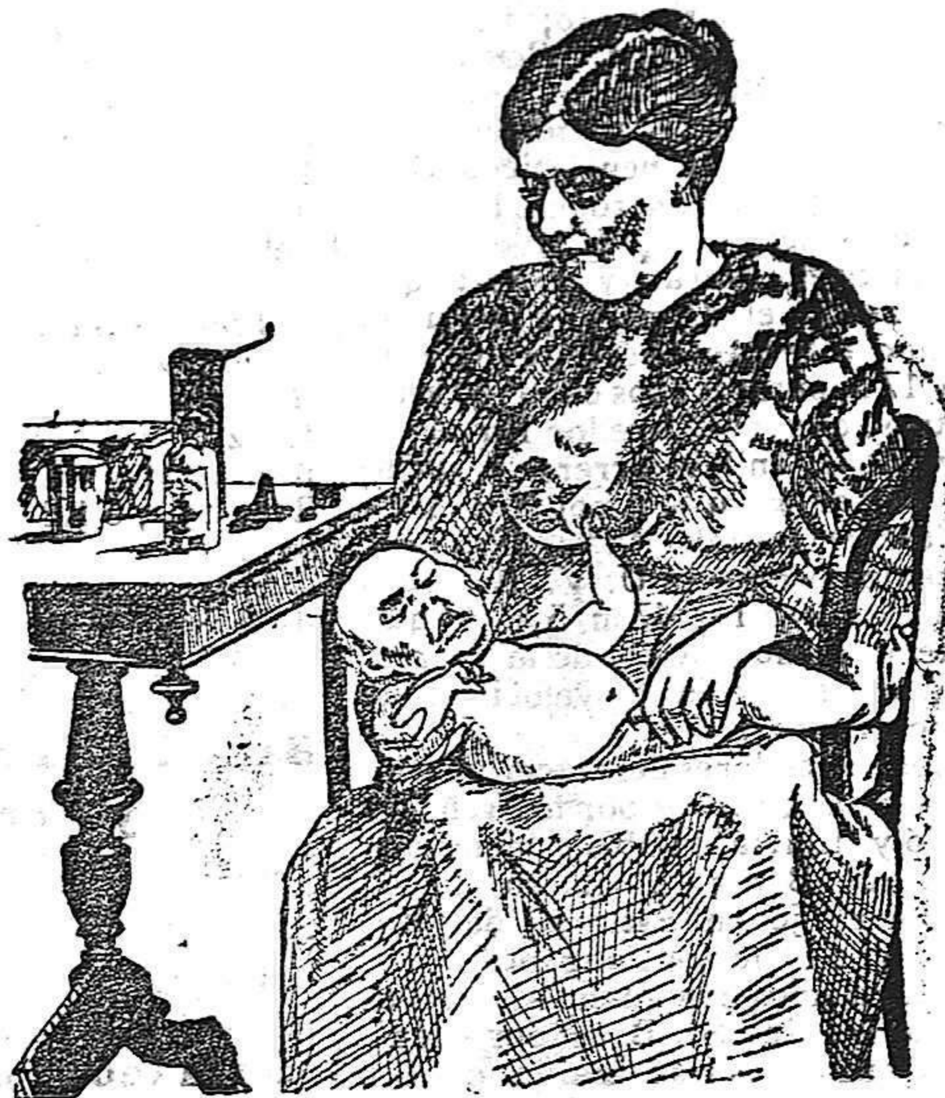
La que no hizo caso del Salverol