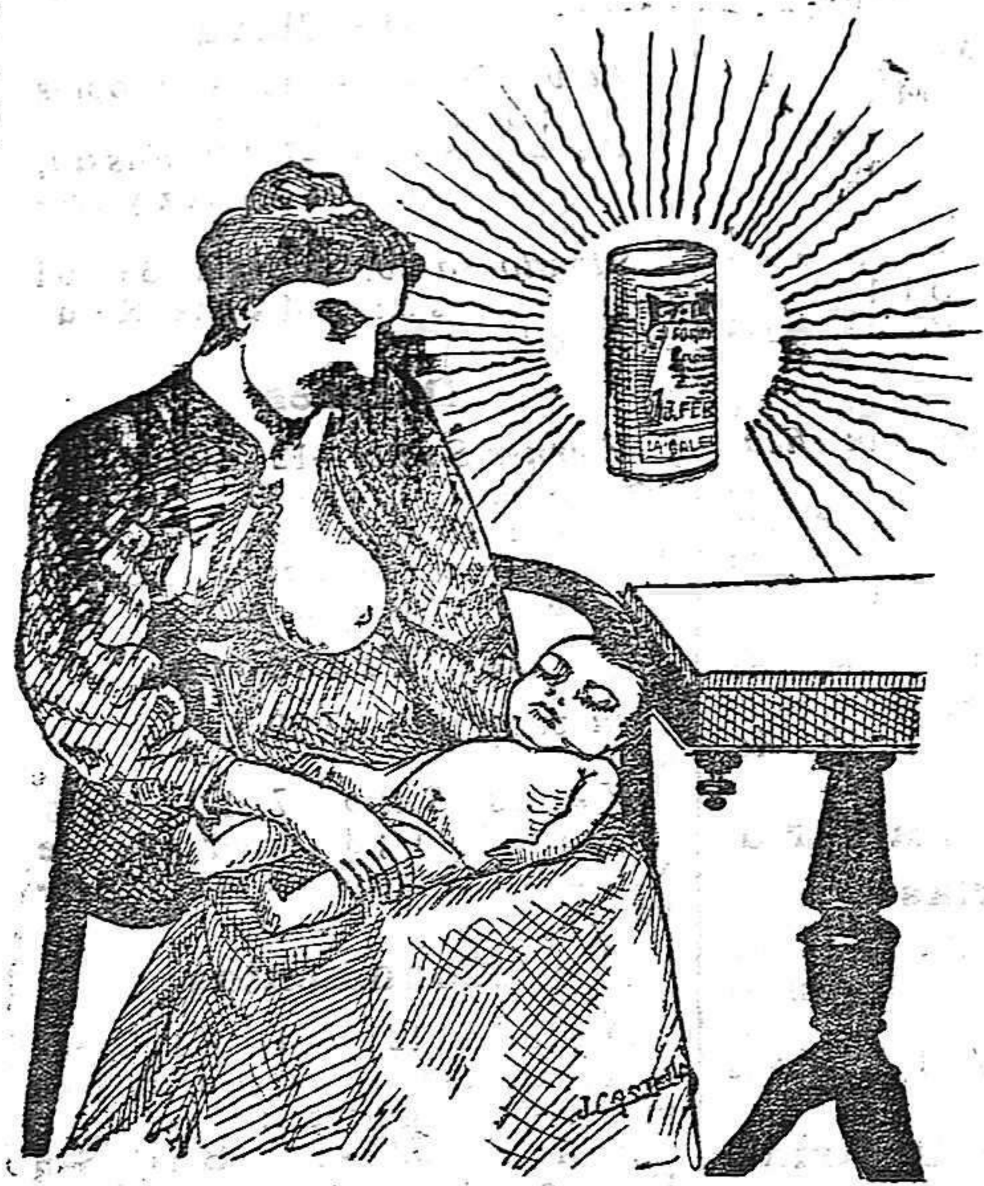
La que hizo caso del Salverol

Depósito general S. A. del Salverol en Santa Bárbara (Tarragona)