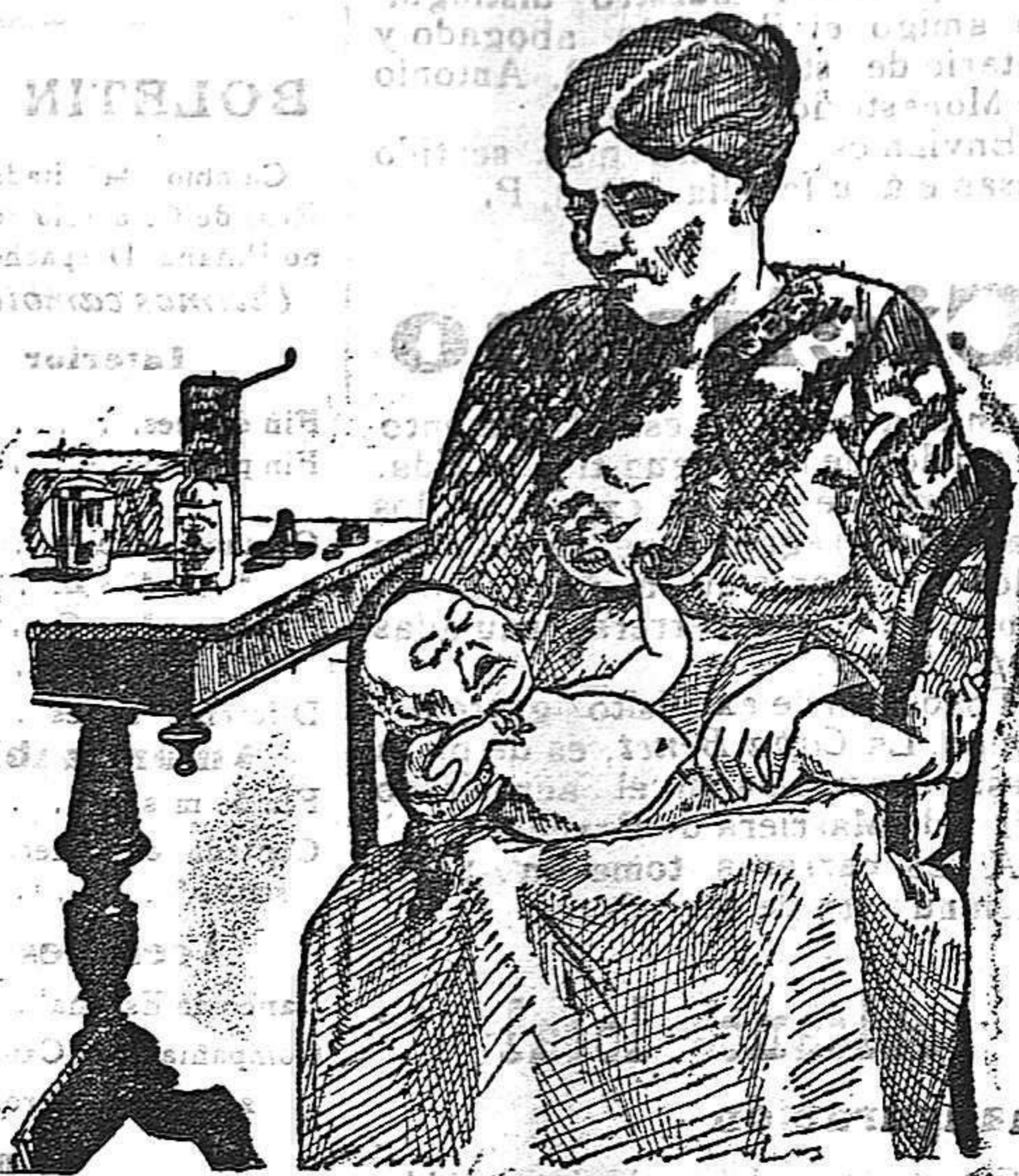
La que no hizo caso del Salverol