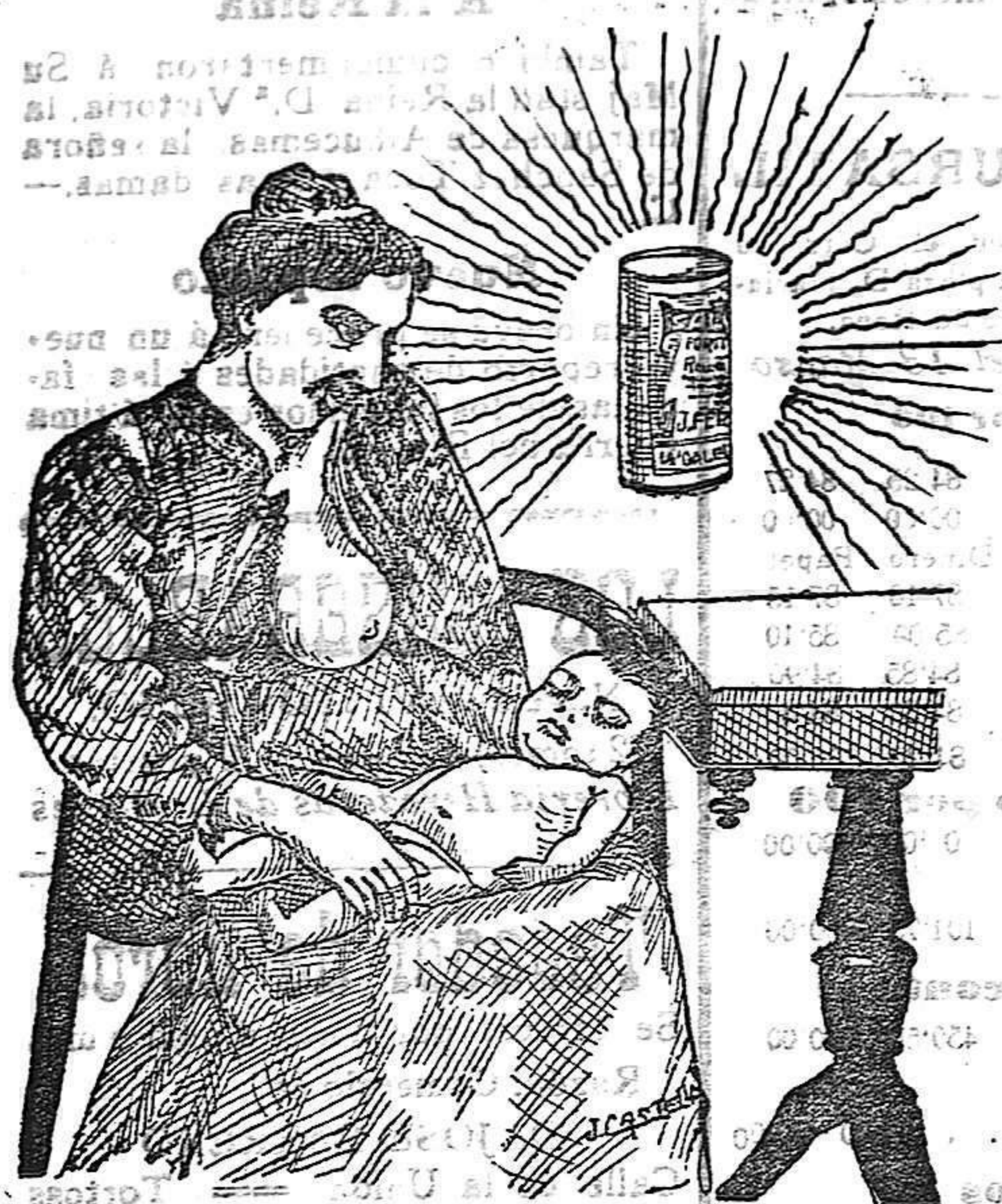
La que hizo caso del Salverol

Depósito general S. A. del Salverol en Santa Bárbara (Tarragona)