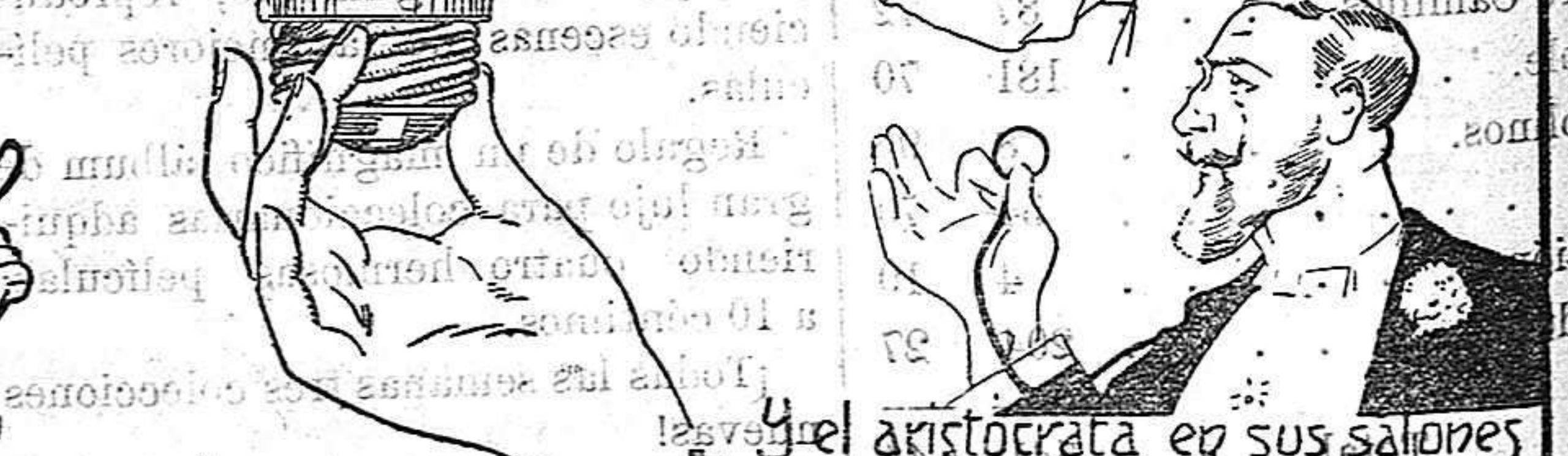
El aristócrata en sus salones