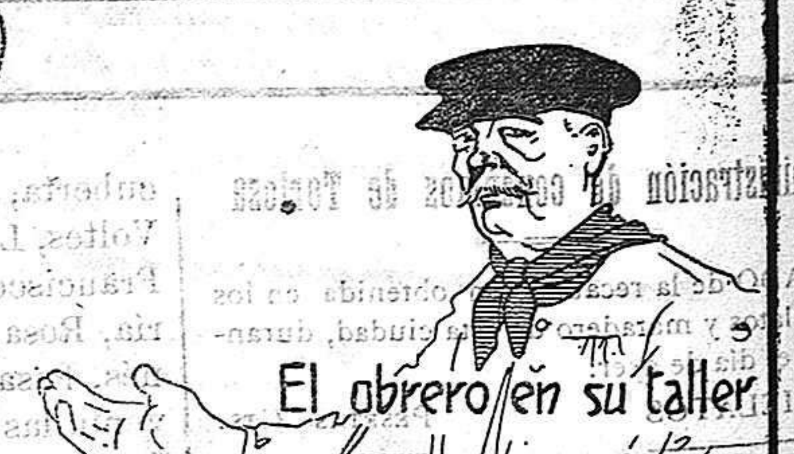
El obrero en su taller