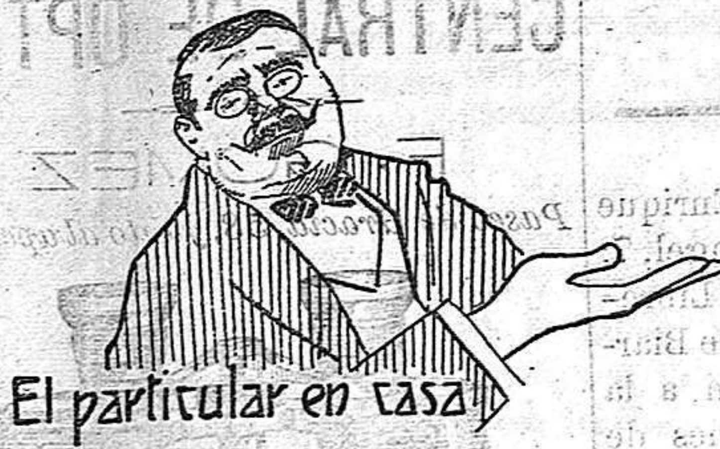
El particular en casa