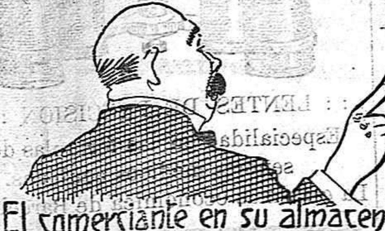
El comerciante en su almacén