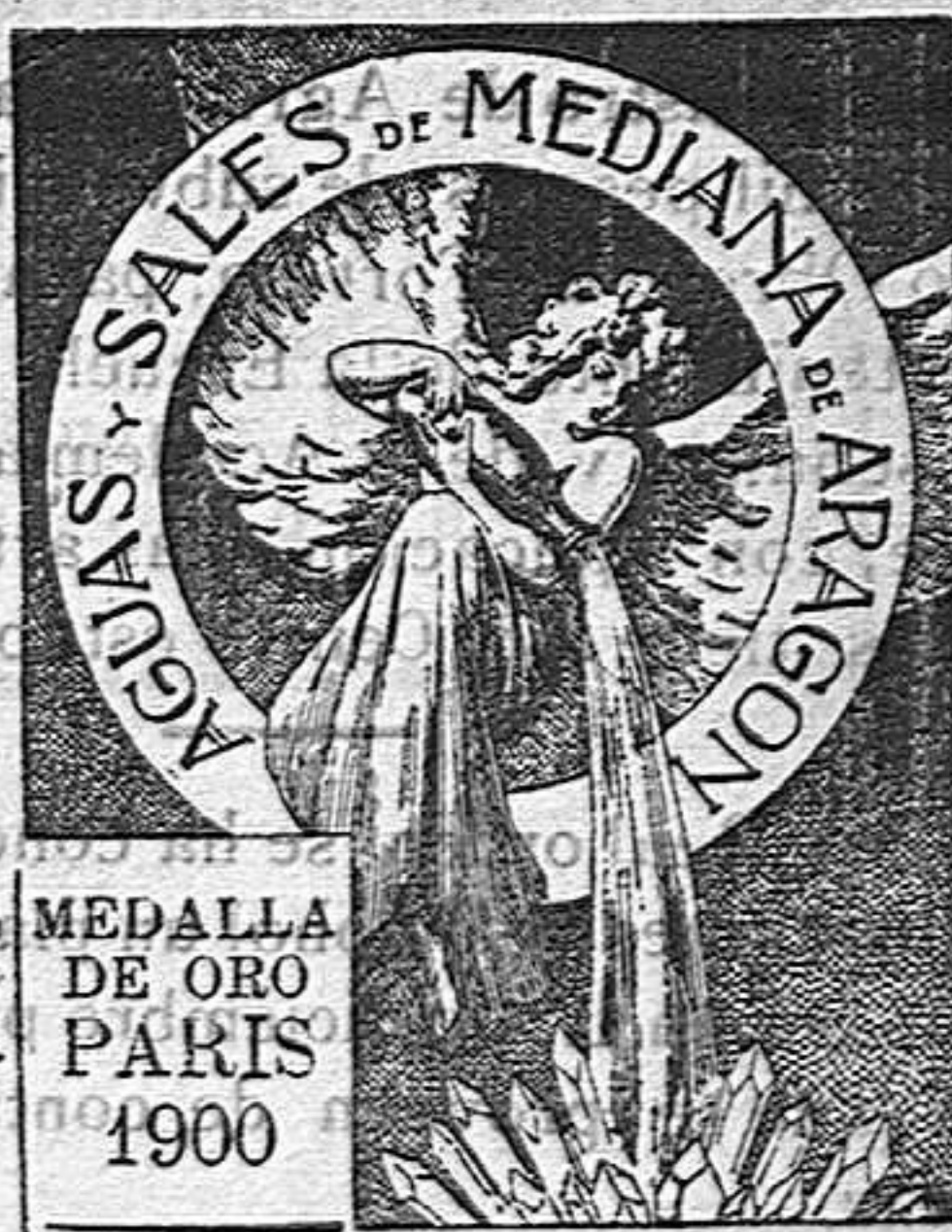
MEDALLA DE ORO PARIS 1900

Tomadas en Loción y Baño son eficacísimas y superiores a todo tratamiento para combatir el Herpetismo, Escarfulismo, Eczemas y todas las afecciones de la piel que tienen por origen la impureza de la sangre.