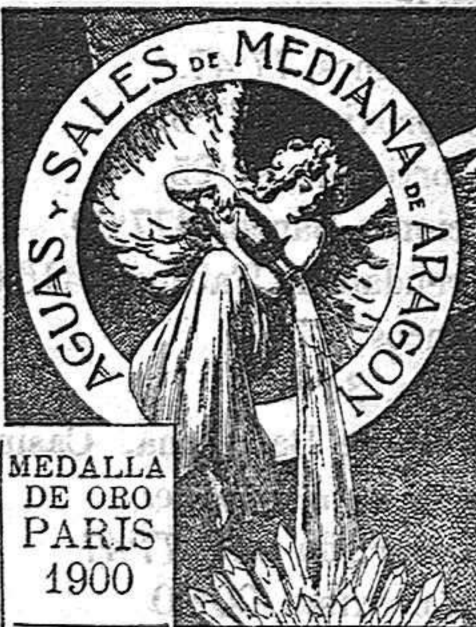
MEDALLA DE ORO PARIS 1900

Tomadas en Loción y Baño son eficacisimas y superiores á todo tratamiento para combatir el Herpetismo, Escarfulismo, Eczemas y todas las afecciones de la piel que tienen por origen la impureza de la sangre.