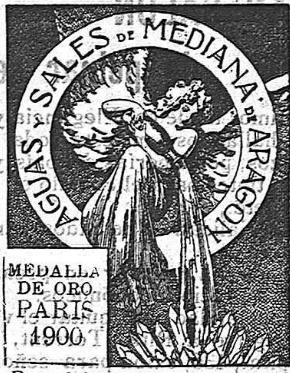
MEALLA DE ORO DE ORO. PARIS 1900.

Tomadas en Loción y Baño son eficacísimas y superiores á todo tratamiento para combatir el Herpetismo, Escrofulismo, Eczemas y todas las afecciones de la piel que tienen por origen la impureza de la sangre.