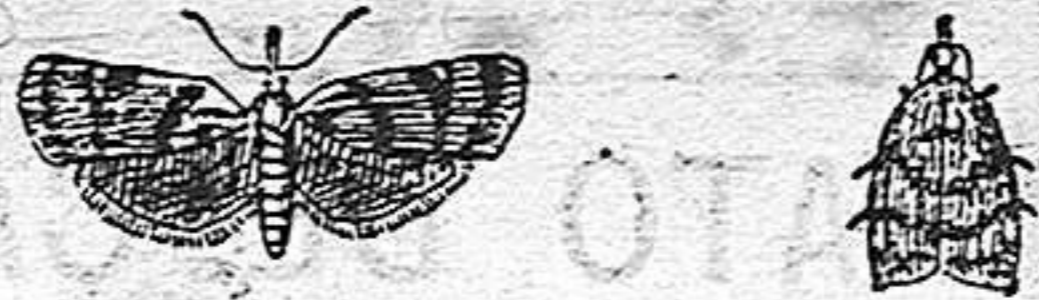
Piral de vid en estado de mariposa

Otro medio, que no solo ha sido aconsejado sino que se ha generalizado en algunos puntos, como Burdeos y el Anjou, es el de colocar entre la viña cosas que les atraigan, con alimentos envenenados, ó luces en donde perezcan los insectos de que tratamos; pero la práctica ha demostrado ser estos procedimientos muy insuficientes.