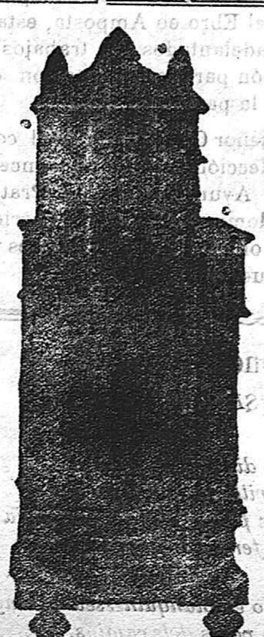
Moncada, 6 y Carmen, 2 y 3