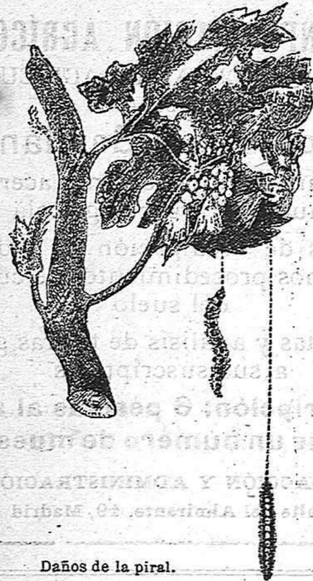
Daños de la Piral.

Se cita entre los medios de defensa, el favorecer a los enemigos de los insectos de que tratamos, ora propagán-