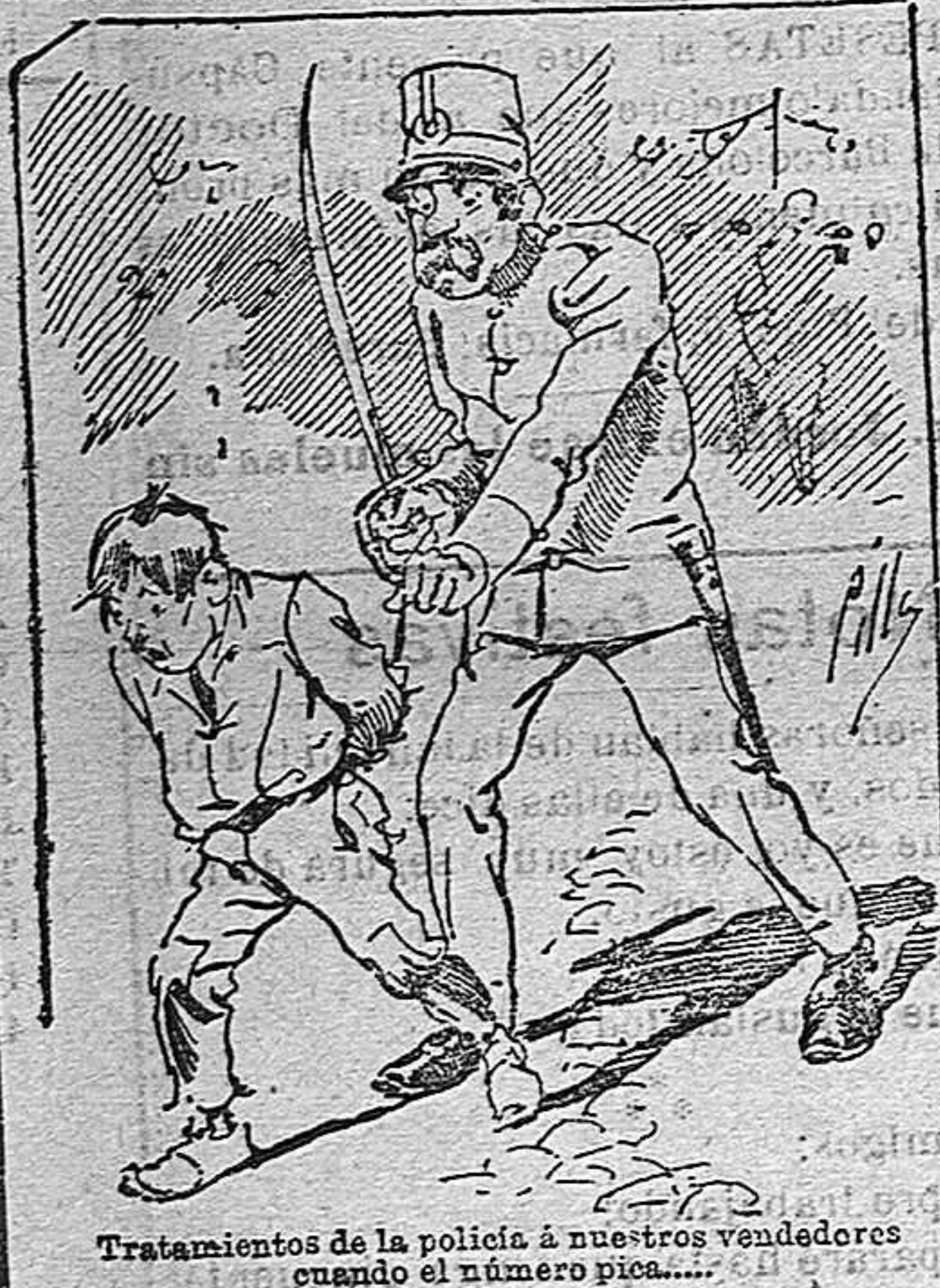
Tratamientos de la policia á nuestros vendedores cuando el número pica.....