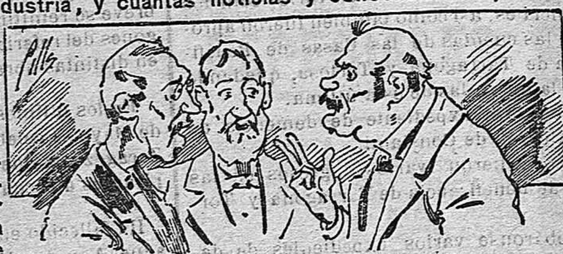
Abominan á nuestros libros..... pero los compran.