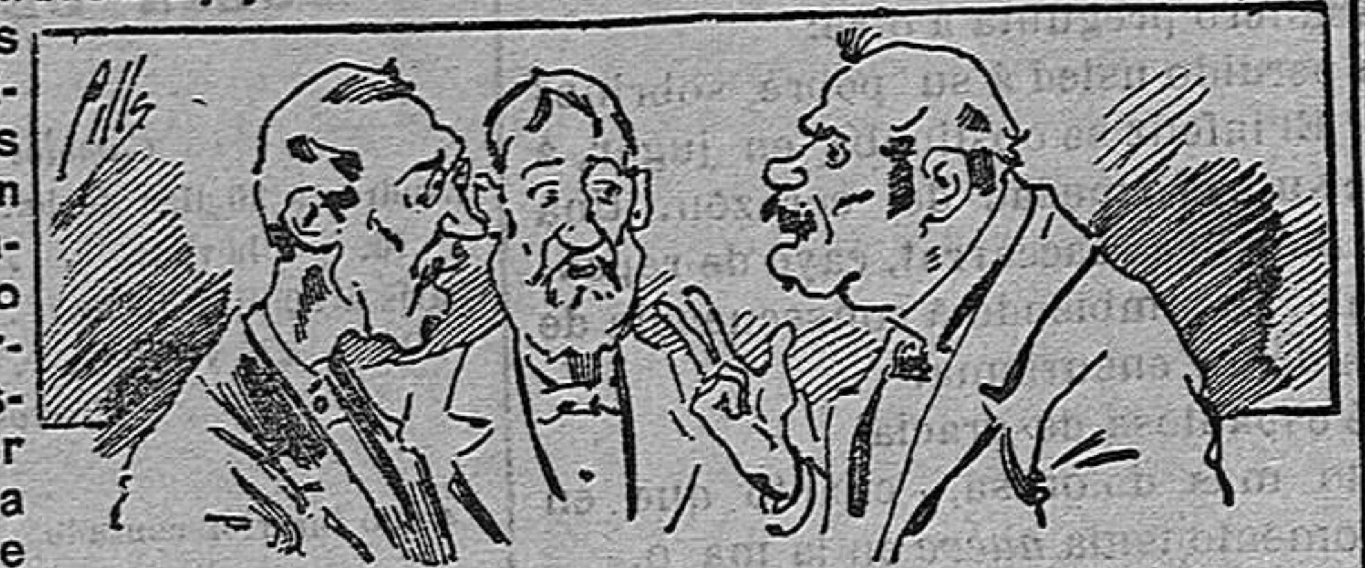
Abominan á nuestros libros....., pero los compran.