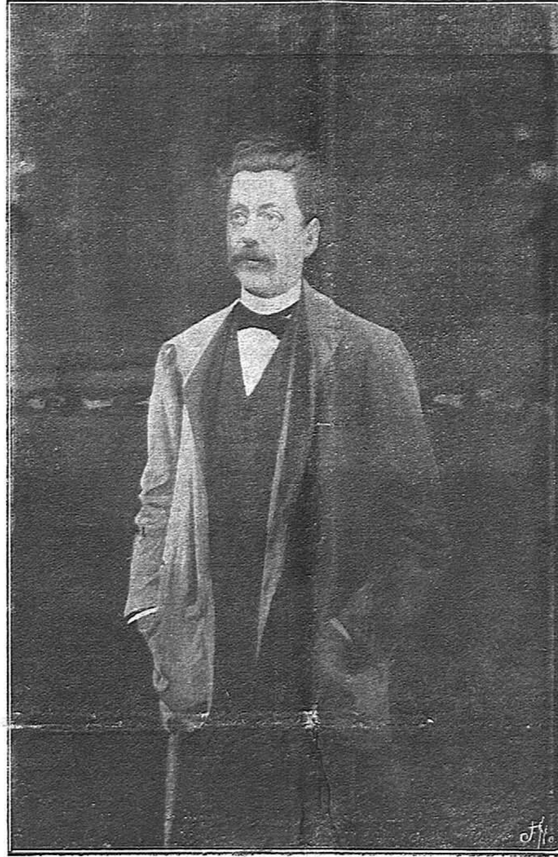
José Yxart y Moragas