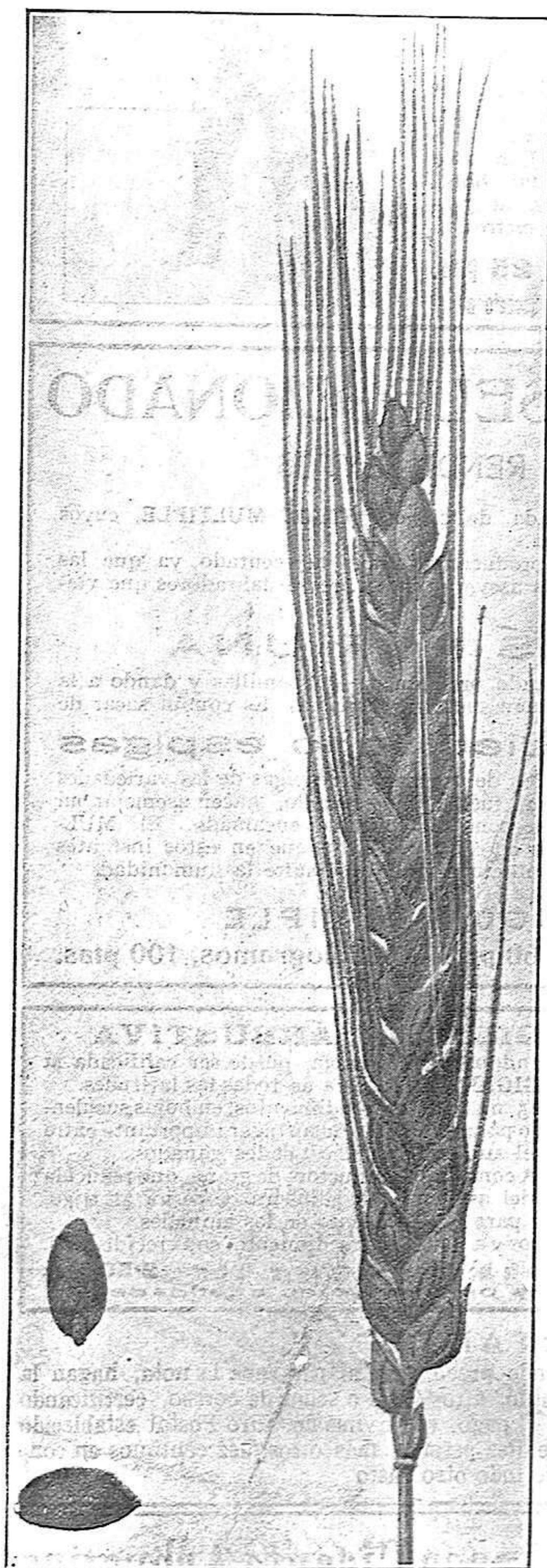
Reproducción fotográfica de una espiga de trigo HERALDO DEL RHIN

Precio del trigo "Heraldo del Rhin" } 5 kgs. 12 ptas. 50 " 100 " 100 " 175 "