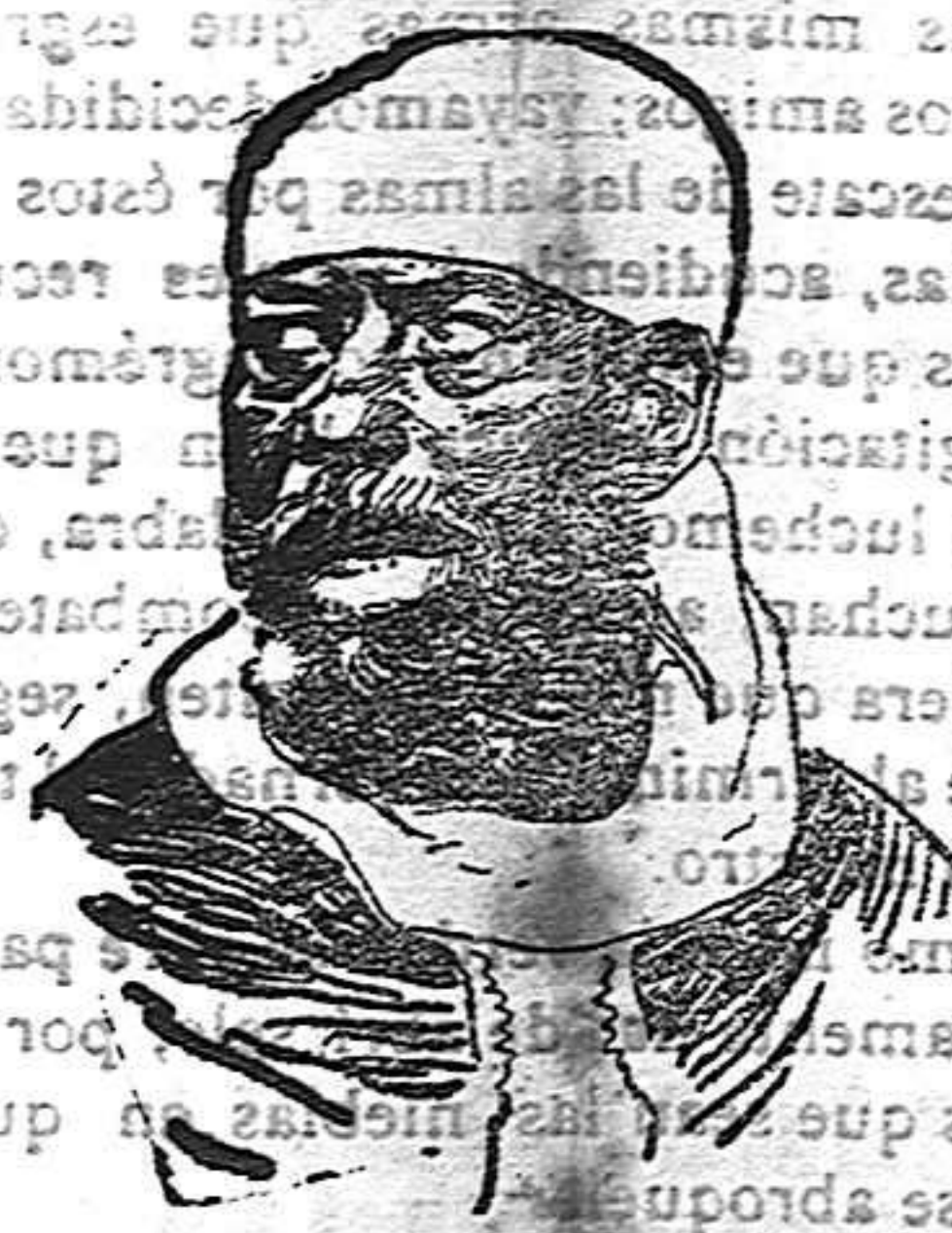
El emperador Menelick de Abisinia

Todavía se ignora si Menelick, el famoso negus de Abisinia ha abandonado definitivamente el mundo de los vivos. Tantas veces se le ha dado por muerto, que no es extraño se le mate una vez más. Sin embargo, parece que ahora, según recientes noticias, Menelick ha muerto de veras, dejando su nación sumida en los desastres de una guerra de sucesión. La emperatriz viuda (?) está encerrada en su palacio así como algunos jefes partidarios suyos. El partido de Lidi, el mayor número de defensores.