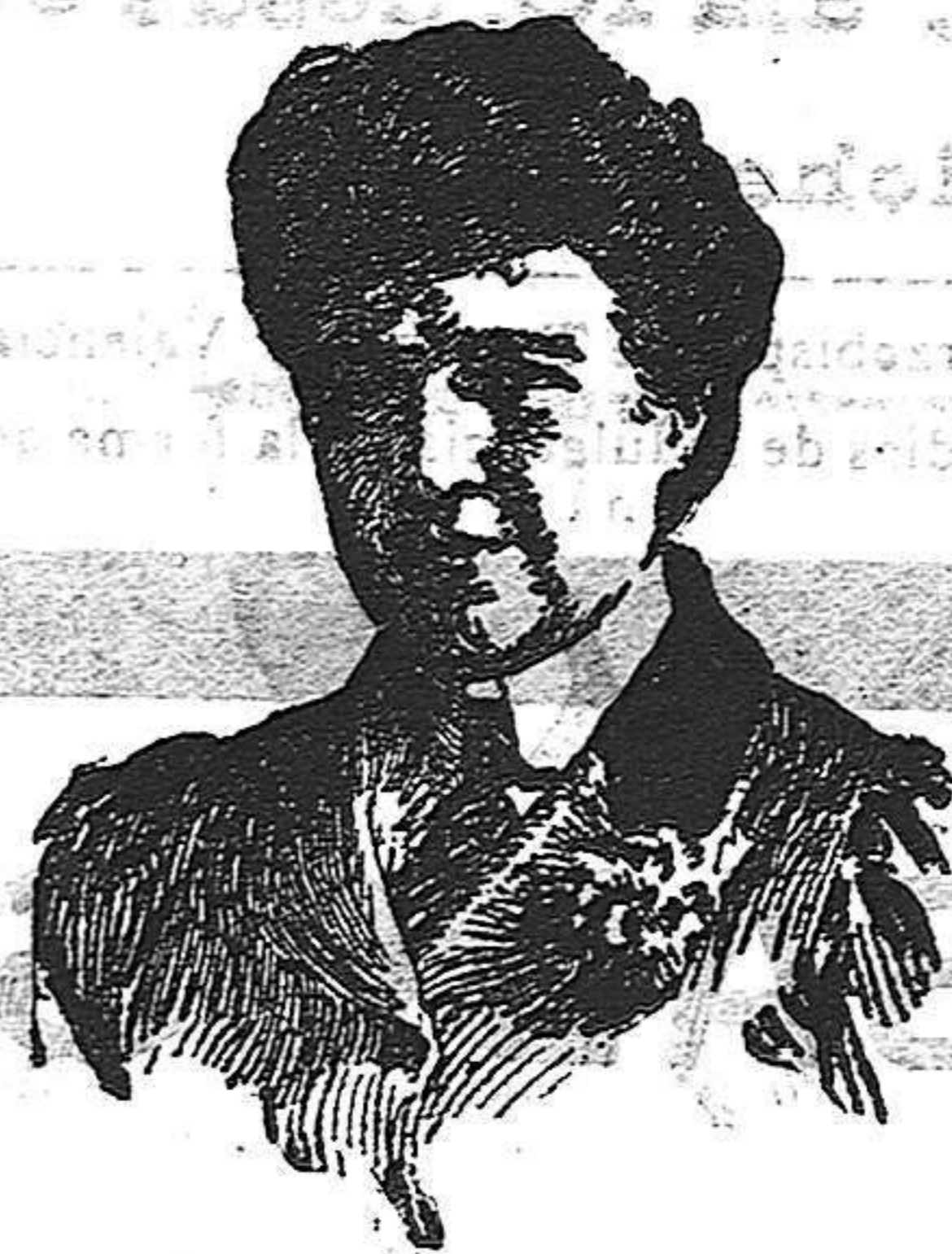
La Reina Amelia

Es don Manuel una figura interesante y simpática, tanto por su juventud, que no le ha permitido hacerse completo cargo de la tempestad que sobre su cabeza se cernía, como por su ilustración, reconocida hasta por sus mismos adversarios.