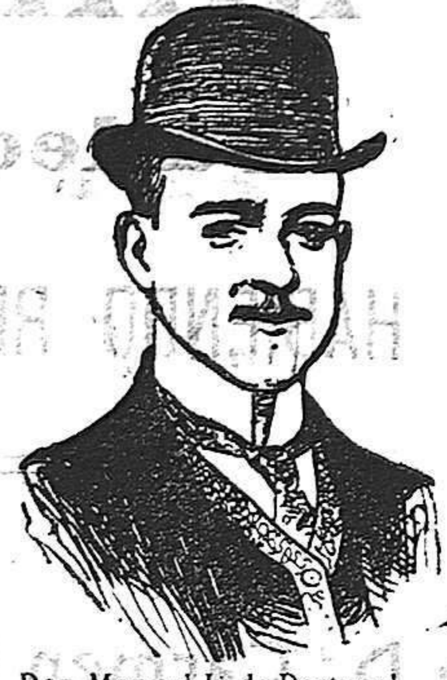
Don Manuel II de Portugal

trono después de una horrenda tragedia buscará la tranquilidad para su espíritu en una nación extranjera, lejos del país donde alegres corrieron los primeros años de su infancia.