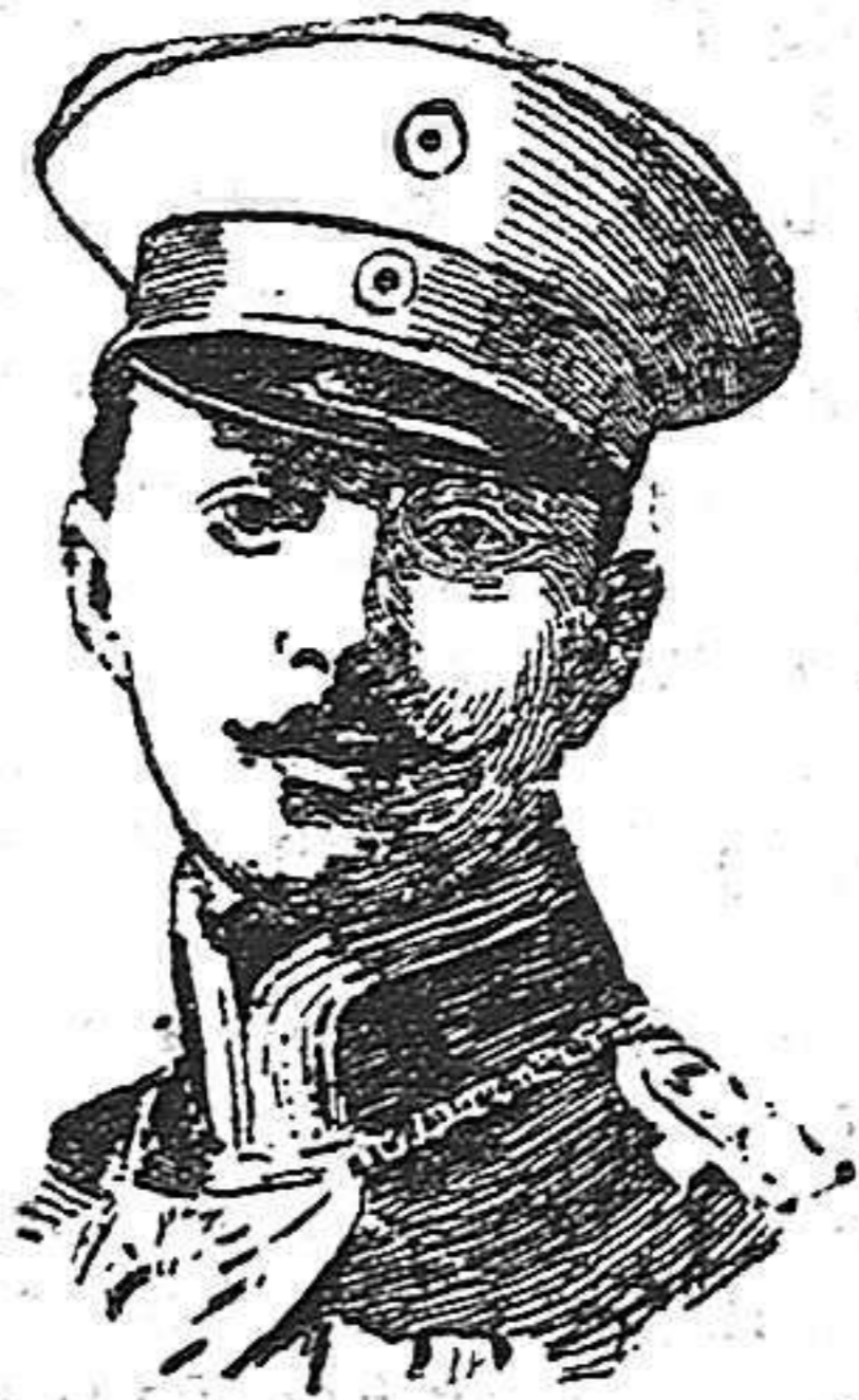
Kronprinz de Alemania

A juzgar por los preparativos, por las personalidades que acompañarán al regio viajero—en su séquito, aparte de la natural representación del ejército, figuran representantes de la Ciencia, de la Política, del Comercio y de la Industria—y por lo que acerca de él se ha dicho, es un viaje del que espera el imperio alemán grandes provechos, tanto políticos como económicos. Es de la exclusiva iniciativa del emperador Guillermo, y por este solo hecho, debe tenerse por seguro que con él se persigue un fin práctico y beneficioso para los intereses comerciales del imperio. El Kaiser, sin embargo de sus genialidades, y lirismos, es un bien cultivado talento, un estadista de envidiables dotes, un hombre que cultivó el positivismo como pocos, aunque á veces sus actos nos lo