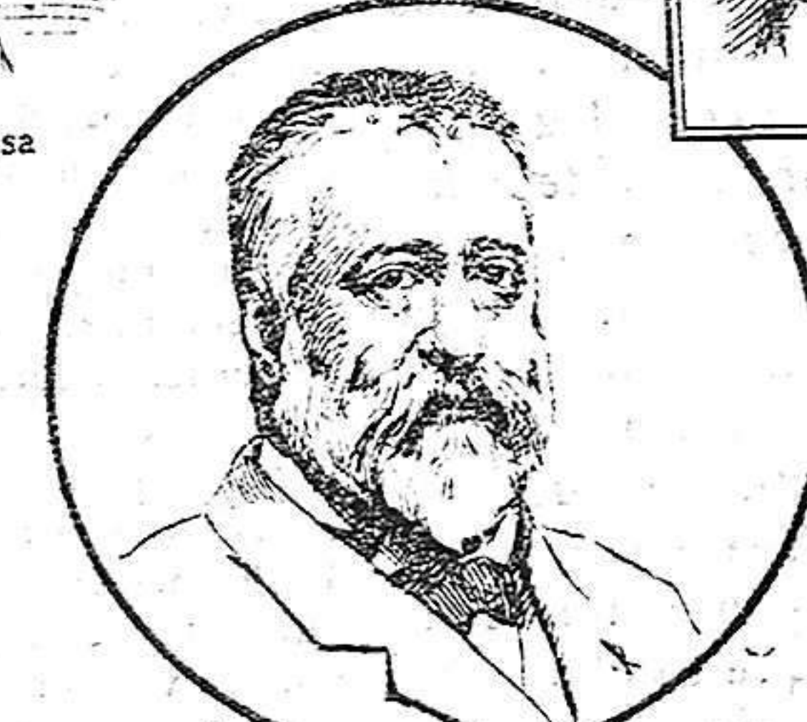
Sr. D. M. Menendez Pelayo