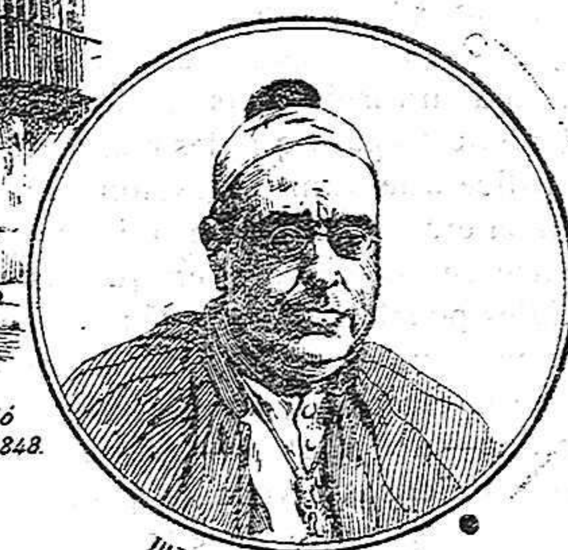
Ilmo. Sr. Obispo de Vich