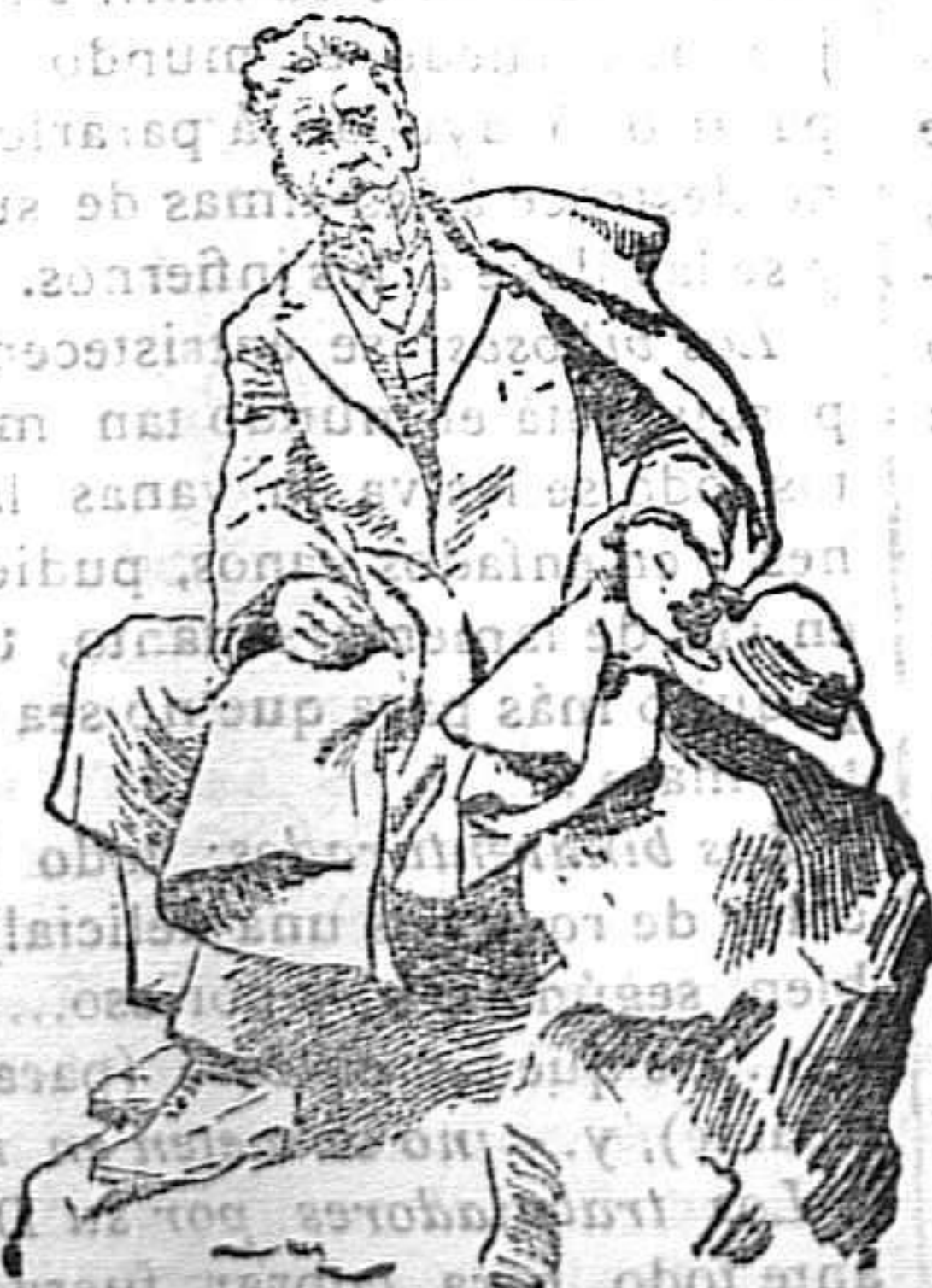
La estatua de Pereda que corona el monumento erigido en Santander.