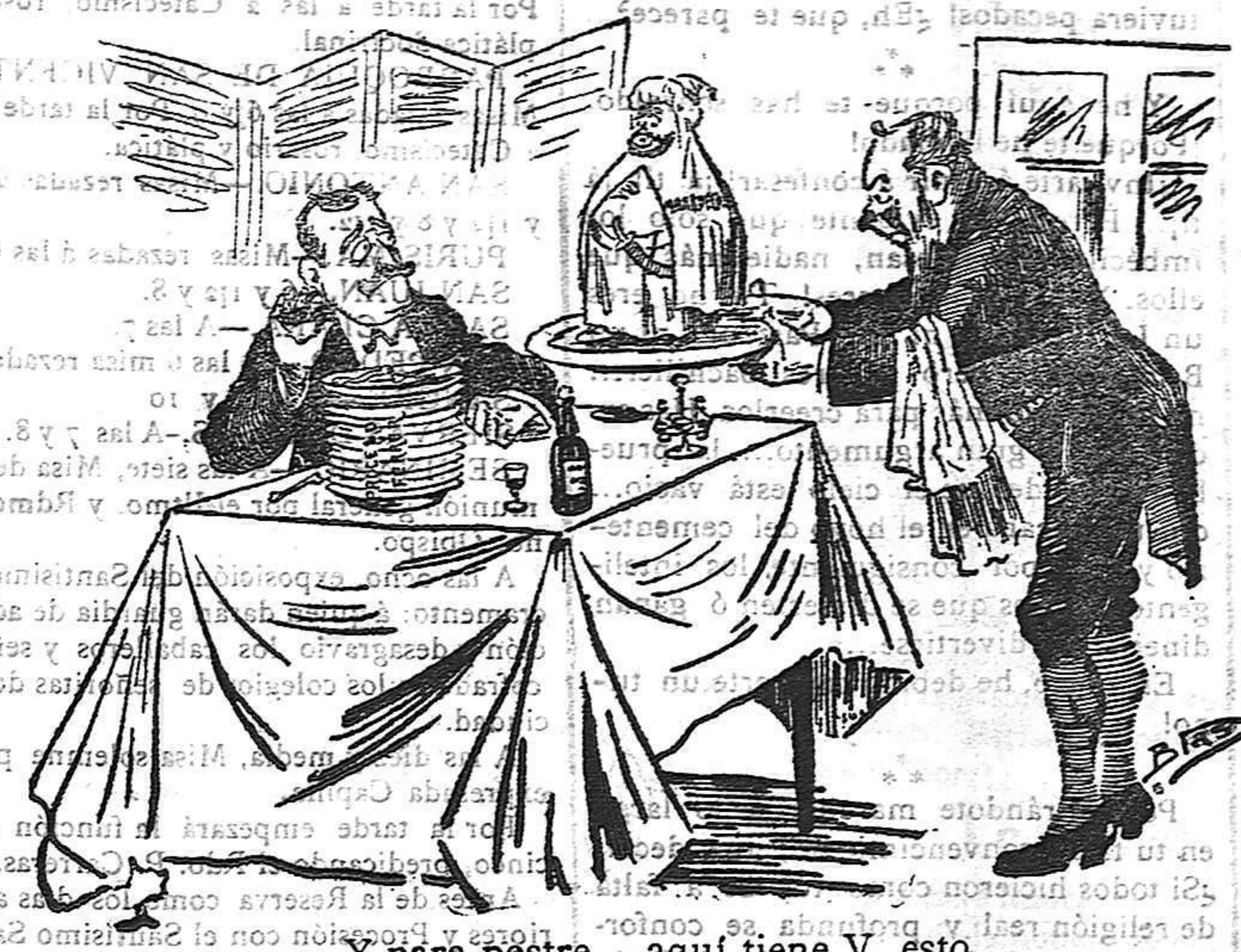
—Y para postre... aquí tiene V. esto.

En lo que se refiere á sus funciones principales y al modo práctico de llevarlas á cabo, así como para cuanto dice relación á la manera de ejecutar los acuerdos de anteriores asambleas (Basilea, Ginebra y Lucerna), el Congreso de Lugano invitó á las distintas Secciones de que se compone la «Asociación Internacional» á presentar un rapport el 1.º de Julio de cada año.