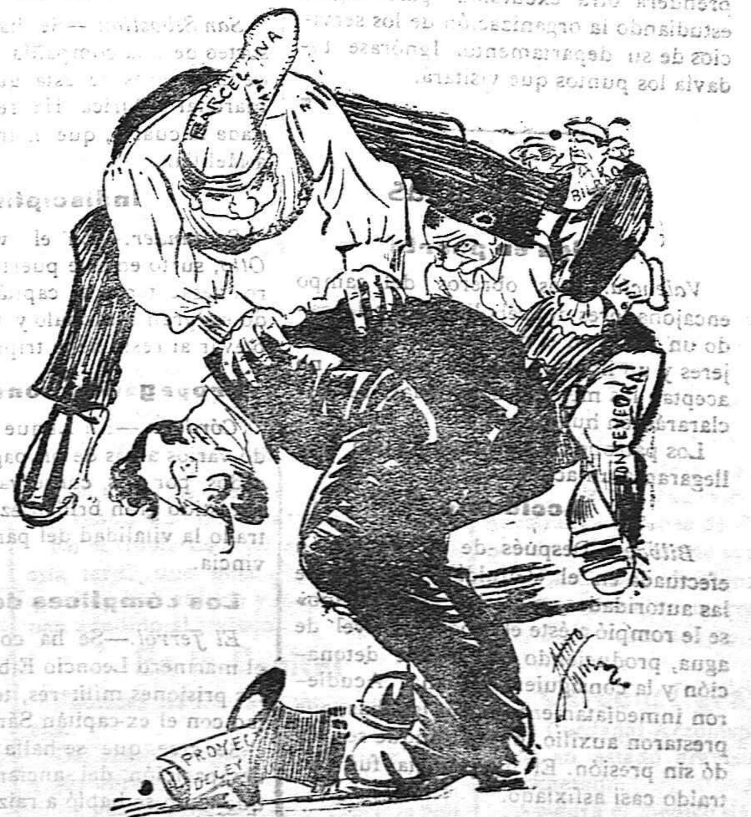
Alba.—¡Bueno! ¡Y todos han de saltar!