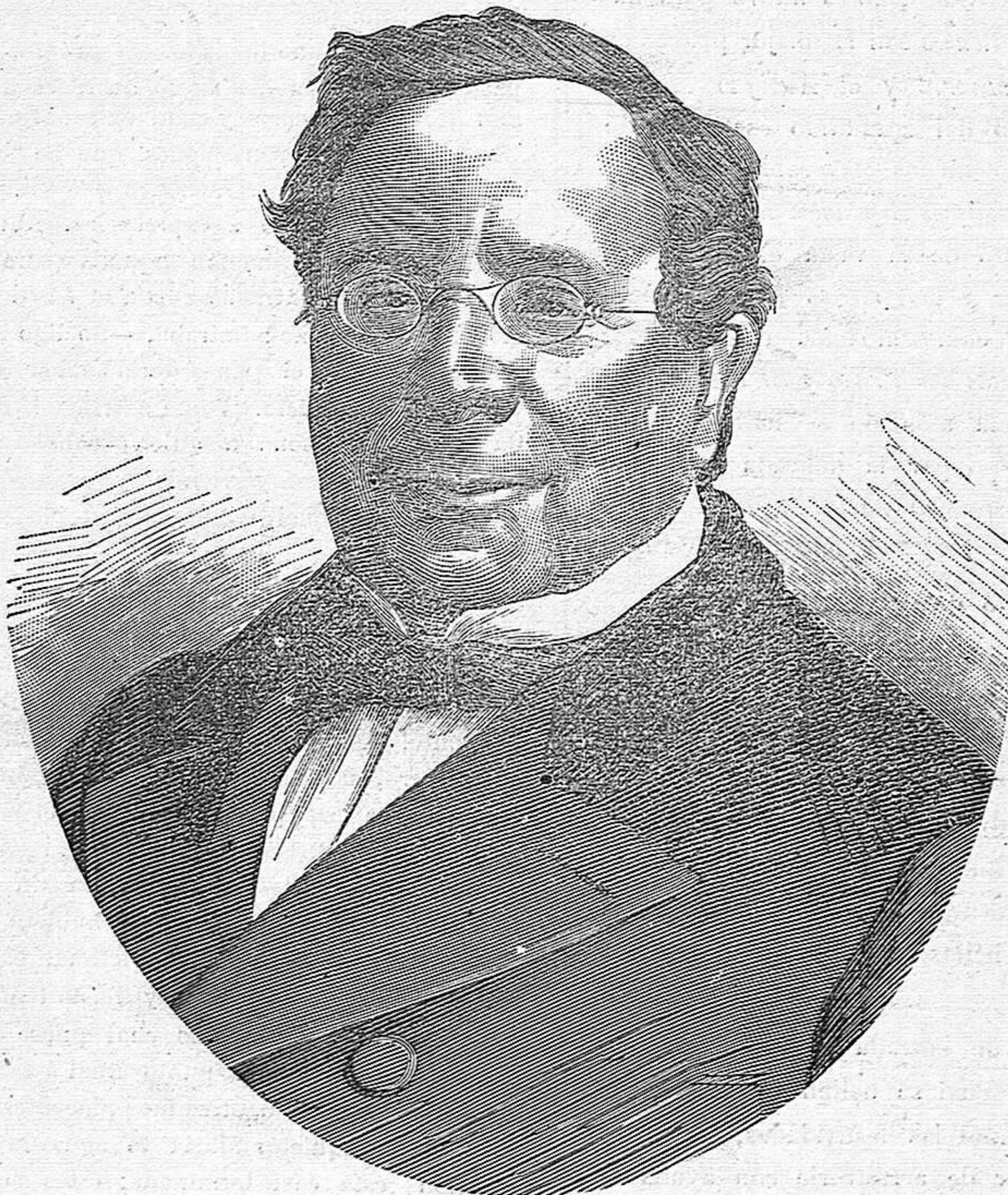
EXMO. SR. D. RAMÓN DE MESONERO ROMANOS.