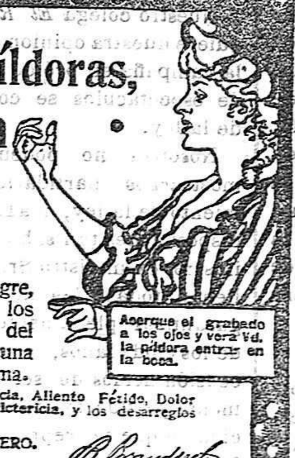
Acercase el grabado a los ojos y verá la píldora entrar en la boca.

DE VENTA EN LAS BOTICAS DEL MUNDO ENTERO.