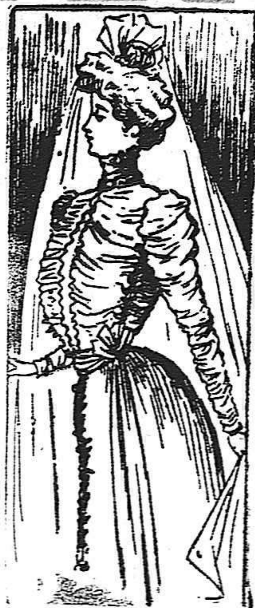
Traje para novia

De raso blanco, forma princesa. Cuerpo ajustado y cubierto de gasa