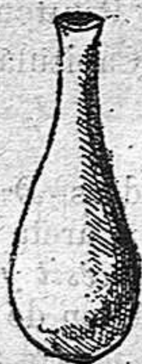
Lacrimatori de vidre