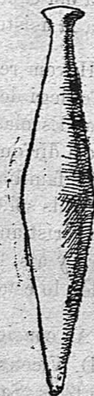
Lacrimatori de vidre