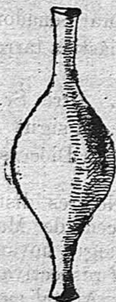
Lacrimatori de terrissa