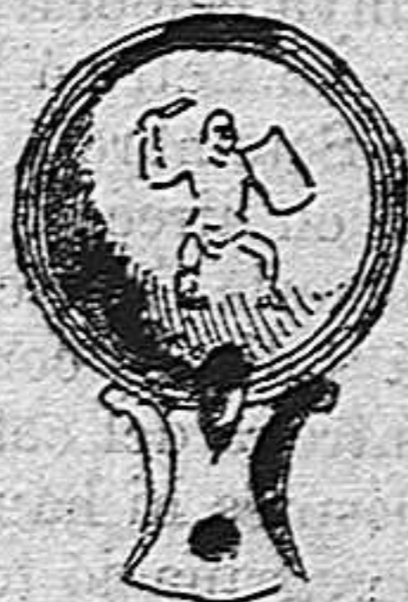
Llántia de terra ó bronze