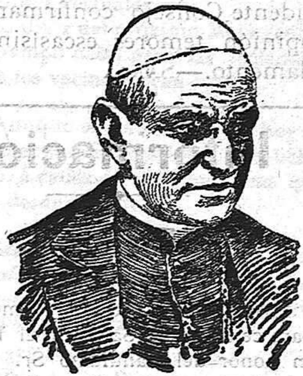
EL EMMO. SR. CARDENAL SANCHA

Esta mañana, nuestro activo Corresponsal, nos ha enviado un telegrama dándonos cuenta del fallecimiento del Eminentísimo Sr. Cardenal Sancha, que ha expirado en la paz del Señor esta madrugada á las dos, después de una agonía prolongada. El lacónismo del despacho telegráfico no nos deja entrever ningún detalle de los últimos momentos del insigne Purpurado que hoy ha bajado á la tumba después de una vida consagrada por entero al servicio de los intereses de la Religión y de España. Dios haya acogido en su seno el alma de este insigne Príncipe de la Iglesia cuya muerte llorarán seguramente todos los católicos españoles.