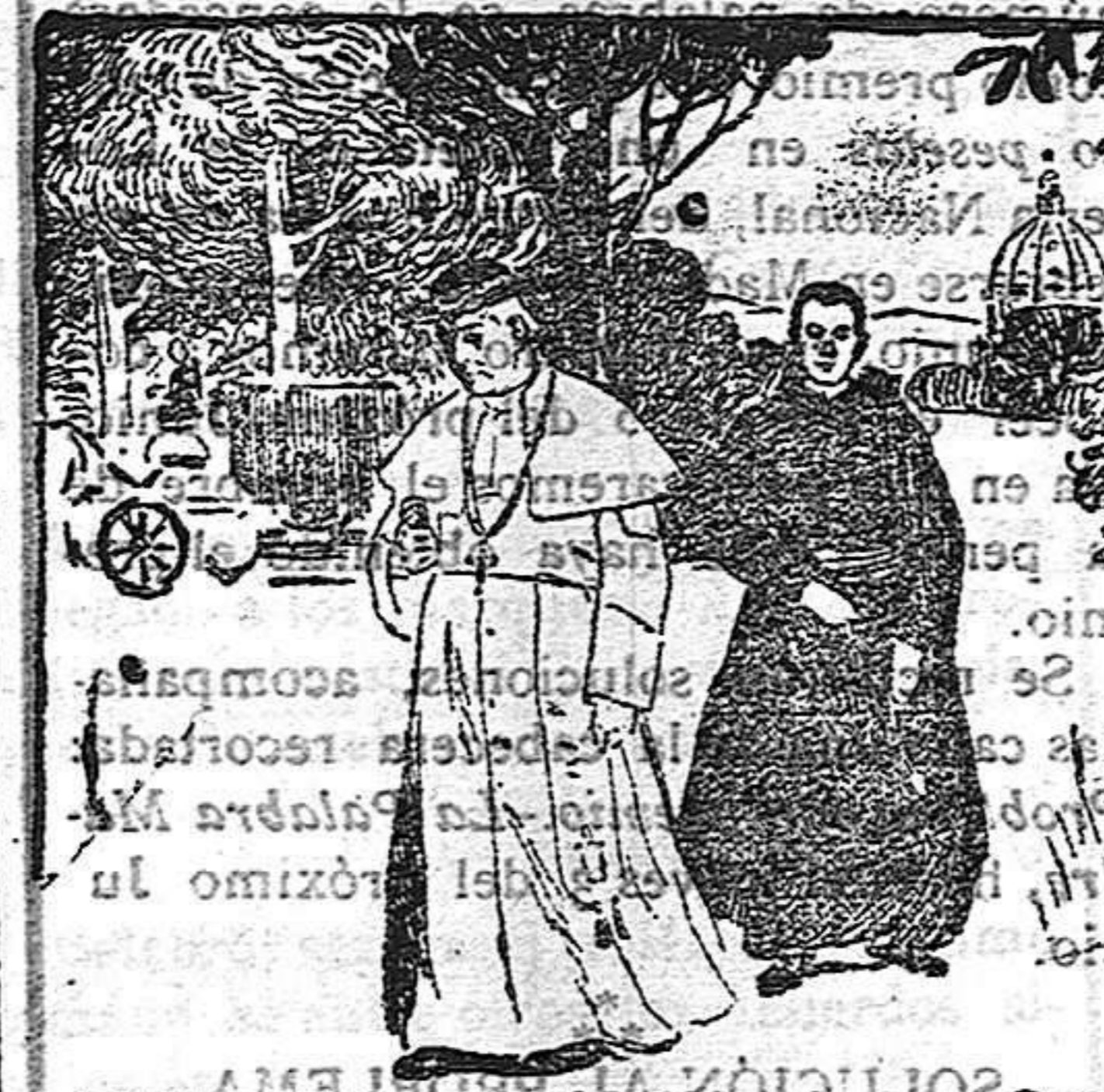
LA VIDA EN EL VATICANO.—S. S. EL PAPA PASANDO POR LOS JARDINES DEL VATICANO.

Monseñor por el cumpleaños del rey de España. Lo de rúbrica, pero más solemne por la asistencia de los Prelados españoles y algunos peregrinos. Oficio de Pontifical el Sr. Obispo de Coria.