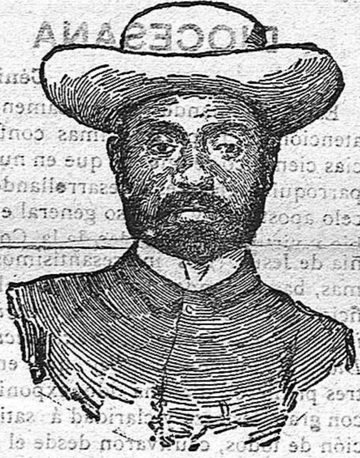
EL PRESIDENTE CASTRO

En Francia, precisamente, no pero si en camino de ella. A cualquiera que se le hubiera dicho, hace dos años, que el «despota» reyzeúelo de Venezuela, como le llamaban algunos periódicos franceses, había de pisar, tras breve lapso de tiempo, el territorio de Francia, seguramente se hubiera reído de tal afirmación, y sin embargo, nada más en camino de ser una inmediata realidad.