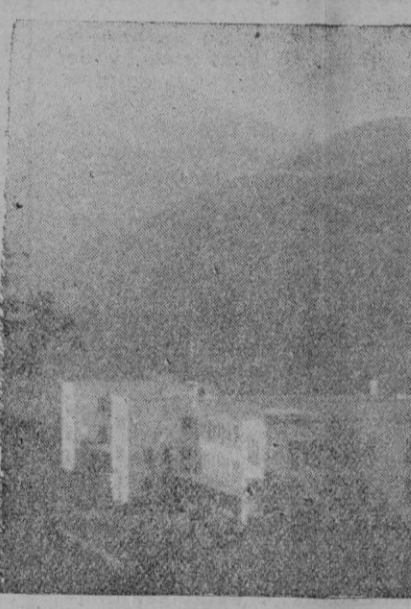
Vista panorámica de Caubet, con los montes que le protegen de los vientos del Norte y la espléndida arboleda que le circunda

España se encuentra en el exterior con que los Gobiernos saben perfectamente lo que ocurre en España. ¿Cómo podemos suponer por un momento que los Gobiernos responsables de las naciones del mundo, no estén bien enterados de nuestro orden, de nuestra justicia, de nuestras prosperidad? Esto es indudable, pero no cabe duda de que existen sectores del exterior que propaganda. Contra esa propaganda vamos y esa propa-