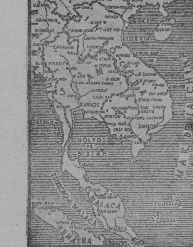
Una de las zonas de la lucha entre el Japón y los EE. UU. e Inglaterra. Al N. la posesión inglesa de Hong Kong, bloqueada por los japoneses. Siam o Tailandia, en gran parte ya ocupada por soldados nipones. En el sur, la península de Malaca es lugar de violentos combates, ya que el Japón tiende a conquistar Singapur por tierra.

Es evidente que el reparto de aceite ha sido inferior al de los años normales, pero en esta disminución no influyen los argumentos que los enemigos de España han propalado, ayudados a veces por los inconscientes, los insensatos y los ignorantes, que, al saberlo, se dedican a hacer el caldo gordo a aquellos, pero la realidad de los hechos es por tierra todo maquinismo.