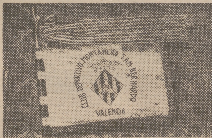
He aquí el banderín que el pasado domingo, con motivo de celebrarse el primer aniversario de la fundación del Grupo Montañero de San Bernardo, le fue impuesto una cinta conmemorativa