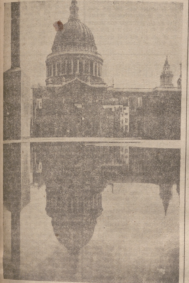
Una vista de Londres, la capitol británica, en donde «Orquídea negra» inició sus actividades delictivas

MANANA: "Era un elemento de oficina... y se hizo uno de los más famosos detectives"