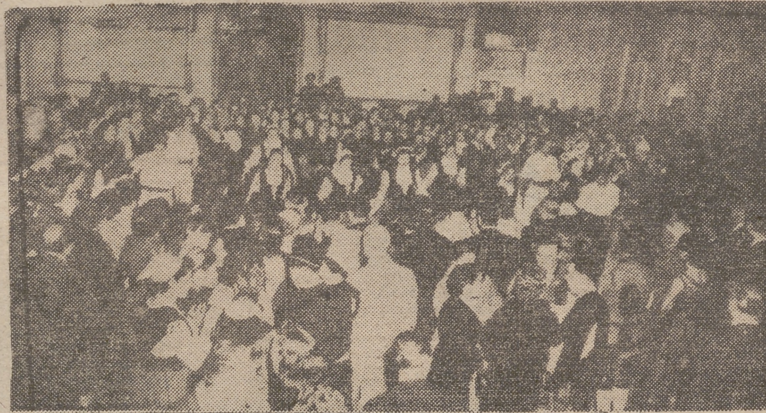
LA HABANA.—Un momento del homenaje ofrecido por el Casino Español de La Habana a los «Coros y Danzas de España», con asistencia del embajador español, señor Lojendio, y otras personalidades.