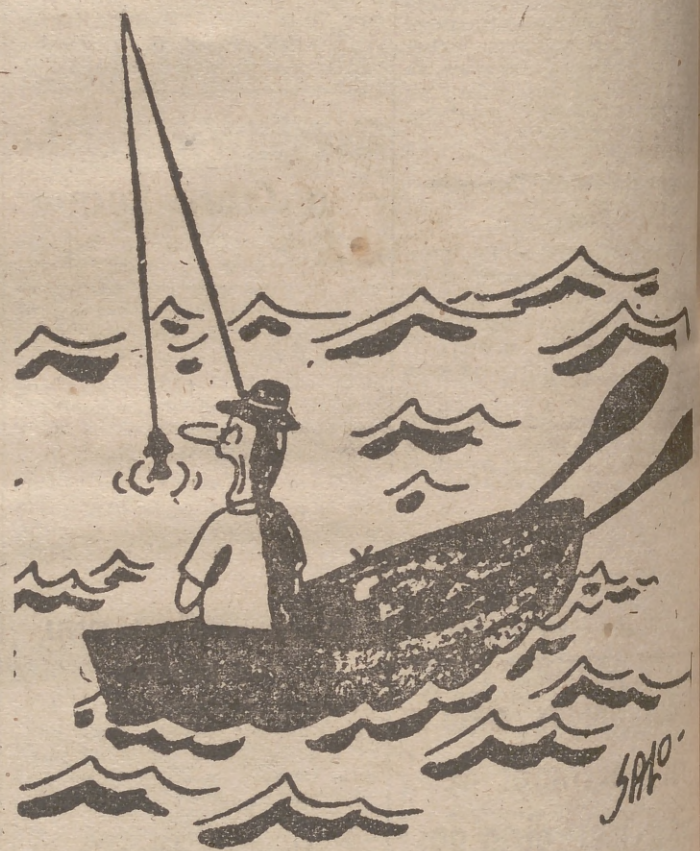
¿Otra vez tú?...