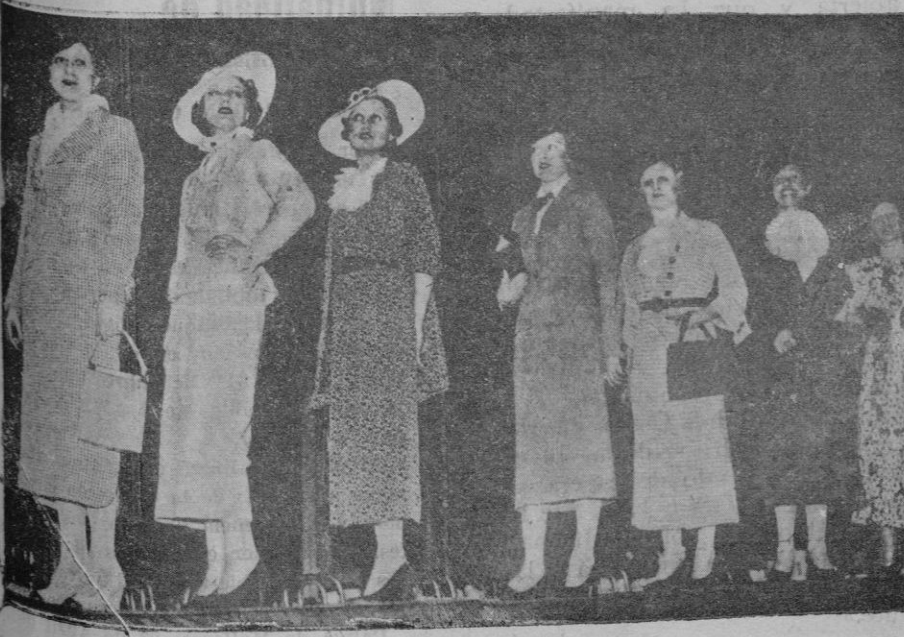
Trajes de calle que se han exhibido en el Salón de la Moda de Italia

Terminada la prueba el señor Fiscal elevó definitivas sus conclusiones provisionales, con la petición de que se aplicara al procesado la Ley de agos. La defensa pidió la absolución o en su