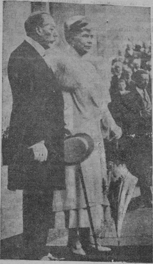
El más reciente retrato de las sobornas inglesas, cuyas bodas de plata de su veintado se celebrarán mañana