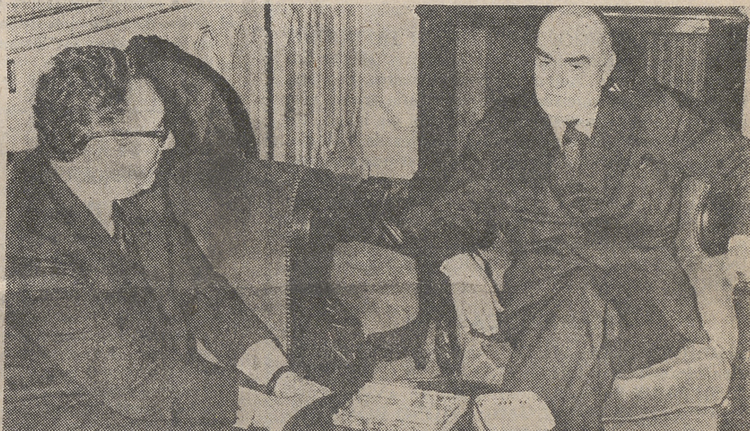
Publicamos la más reciente foto recibida, en la cual aparece el Almirante Carrero Blanco durante la visita que le hizo el profesor Kissinger, secretario de Estado norteamericano, durante su estancia en la capital de España, cuya información aparece con otras del mismo tema en nuestra pág. 12.

dente del Gobierno y Subsecretario de la Presidencia. Y el día 9 de junio de 1973, está en la memoria de todos los españoles, el acto de la Jura como Presidente del Gobierno en virtud de la Ley inserta en el «Boletín Oficial del Estado» (8 de junio) que decía textualmente: «En uso de las facultades que me conceden las leyes de 30 de enero de 1938