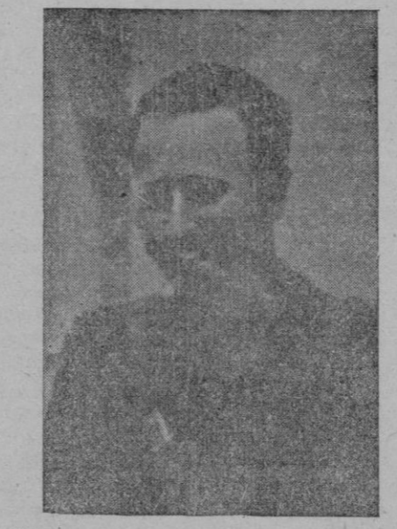
El Sr. González Bueno, ministro de Organización y Acción Sindical, en el acto de bendición de los locales de la central Nacional Sindicalista de Pamplona.

BENDICION DE LOCALES Pamplona — Hoy con toda solemnidad y brillantez se ha celebrado el solemne acto de bendición e inauguración de locales de la central Nacional Sindicalista de esta capital. Asistieron al acto el Ministro de Organización y Acción Sindical, Sr. Pedro González Bueno y el Subsecretario del Ministerio de Justicia Sr. Arrellano. El Ministro de Organización y Acción Sindical penetró en el edificio de la Central Nacional Sindicalista, que es magnífico, acompañado de los jefes del Movimiento. El Sr. González Bueno visitó detenidamente todas las dependencias y departamentos expresando a la vista de la magnífica instalación y funcionamiento de los mismos su viva satisfacción. En el vestíbulo del edificio se halla en bronce un magnífico busto del Caudillo.