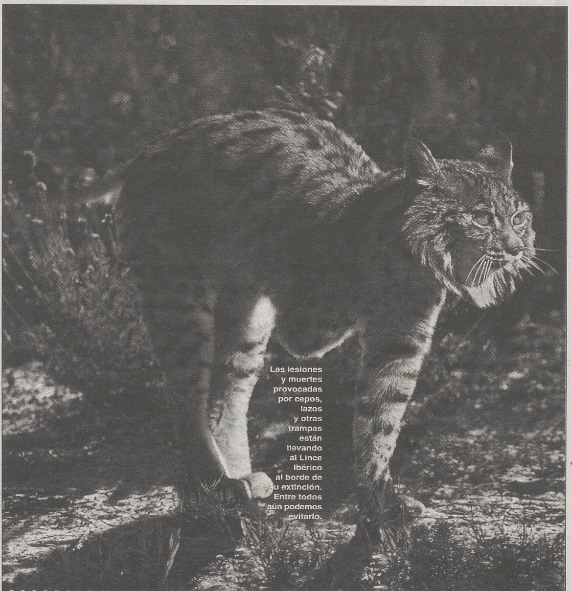
Las lesiones y muertes provocadas por cepos, lazos y otras trampas están llevando al Lince Ibérico al borde de su extinción. Entre todos aún podemos evitarlo.

SEÑORA VIUDA y culta, 55 años, busca amistad seria con caballero de 50 a 60 años, con buena presencia y buen sentido del humor. Apartado de Correos 307.