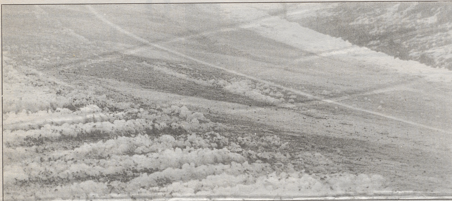
Ante la presencia de placas de hielo en la carretera sólo vale la precaución. Es preferible esperar a salir de ellas para recobrar adherencia que frenar bruscamente.