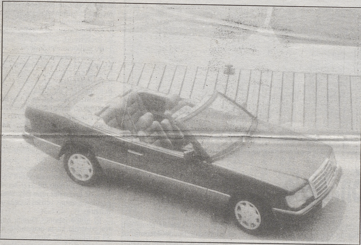
Soberbio aspecto para este descapotable de Mercedes.

Mercedes 300 CE-24 Esperado largo tiempo por los aficionados del descapotable de cuatro plazas, Mercedes Benz ha presentado en la Feria Internacional del Automóvil de 1991 el nuevo Mercedes Benz 300 CE-24 descapotable. El cuatro plazas abierto surgió a partir del Coupé del mismo nombre, con el potente motor de 162 Kw (220 CV), de tres litros y seis cilindros, técnica de 4 válvulas por cilindro. De momento este descapotable se entregará únicamente en esta versión. la capota, de lona forrada, totalmente escamoteable, con luneta trasera eléctrica en cristal de seguridad, puede retirarse y ser colocada fácilmente de forma manual como equipo de serie. Opcionalmente puede pedirse un sistema automático electrohidráulico. El elegante y deportivo descapotable ofrece sitio más que suficiente para cuatro personas adultas y la máxima seguridad gracias al dispositivo automático de protección, situado detrás de los asientos traseros. Las prestaciones de este descapotable se diferencian muy poco de las del coupé que le ha servido de base. Con cambio de cinco marchas de serie. La aceleración de 0 a 100 Km/h se alcanza en 8,7 segundos. La velocidad máxima es de 250 km/h. La comercialización del 300 CE-24 descapotable se iniciará previsiblemente a mediados de 1992, estando limitada de momento la producción anual a 5.500 unidades.