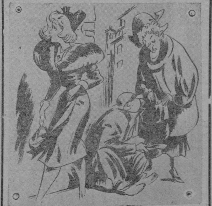
—Señora: Me permito aconsejarle que me socorra hoy mismo, porque desde mañana me verá obligado a aumentar los precios... y en verano, ¡va verá usted las tarifas que regirán! (De "El Traveso" Roma)