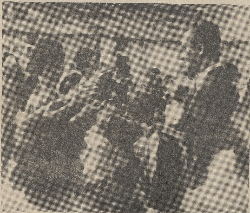
RODEADO POR LA MULTITUD.—En San Diego (California), varias docenas de niños rodearon al Príncipe de España don Juan Carlos de Borbón, tratando de obtener un autógrafo. La popularidad de los Príncipes ha sido una de las principales características de su visita oficial a los Estados Unidos, que ha constituido un éxito extraordinario.

Acto seguido los Príncipes, Juan Carlos y Sofía,