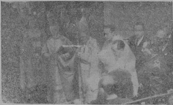
El Excmo. y Rmo. Sr. Obispo de Menorca bendice en Mahón el nuevo Palacio de Archivos, Bibliotecas y Museos, cuya información publicamos ayer