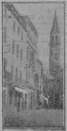
Sobre el conglomerado de las casas de la ciudad de Manacor levanta hacia el cielo su aguja afilada el campanario de la iglesia parroquial

El viernes, día 19, "Día del Santo Cristo y fieles difuntos". Supragios a favor de los numerosos difuntos y suntuoso acto de homenaje y pleitesía a nuestro venerado Santo Cristo. El sábado, día 20, "Día de la Parroquia" Homenaje a nuestra madre, a sus obras, asociaciones, fieles todos.