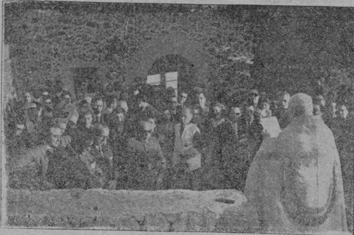
Autoridades e invitados, momento antes de la bendición