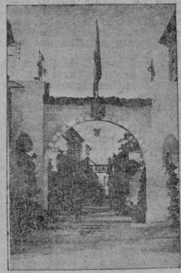
El magnífico arco de triunfo que los albañiles de Santanyí levantaron en honor de la Virgen de Lluch

sores y los niños, destacándose entre los diversos actos el vibrante Coro hablado.