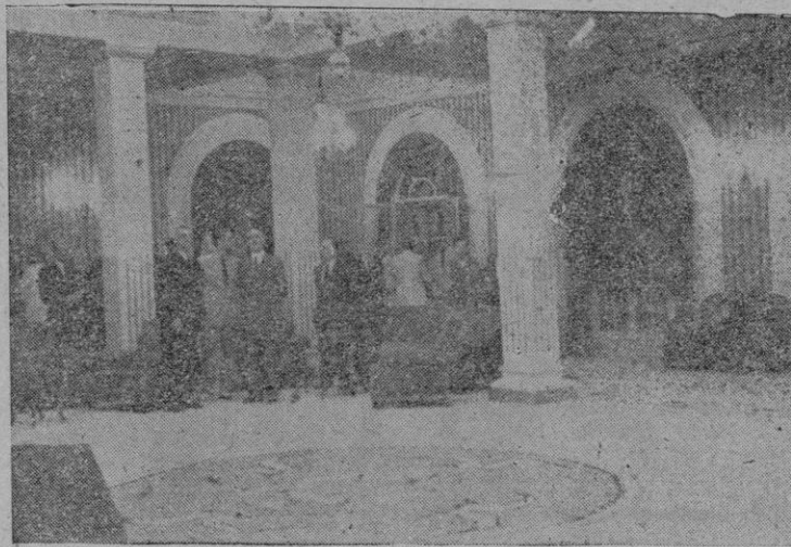
Las Autoridades durante su visita al espléndido salón de fiestas del Club Náutico