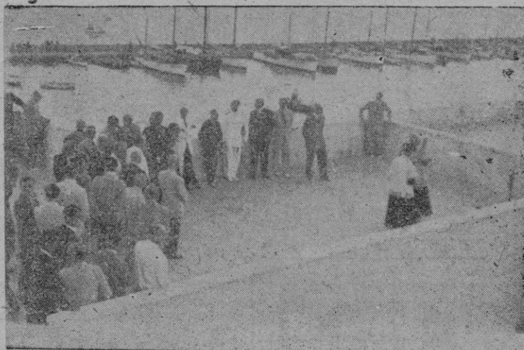
El Gobernador Eclesiástico bendice, desde una de las terrazas del Club Náutico — en presencia de las Autoridades — las edificaciones de la dársena de San Pedro