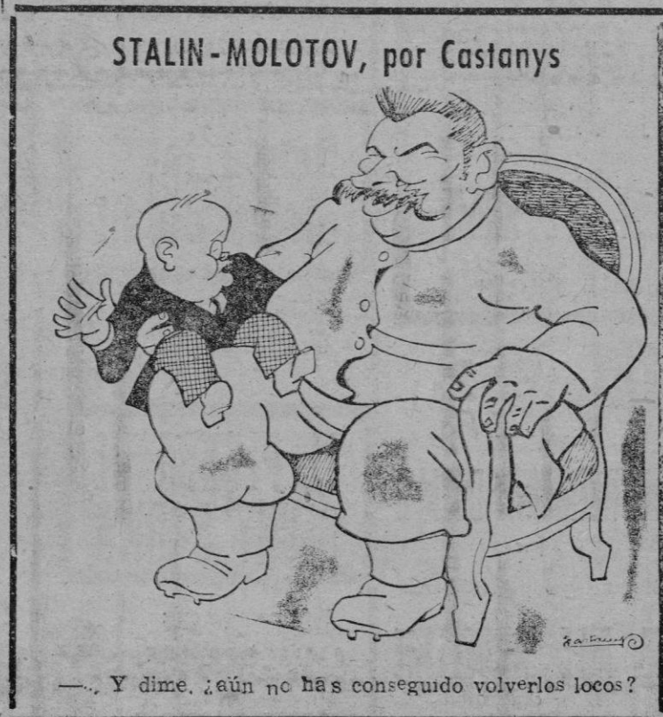
— Y dime, ¿aún no has conseguido volverlos locos?

GINEBRA, 18 (Efe). — El túnel de San Gotardo, principal arteria de tráfico a través de los Alpes, se encuentra en peligro ante el avance del fuego por las galerías de un depósito de municiones que se encuentra cerca de la boca del túnel en Gosehenen. Continúan las explosiones con gran violencia, que va aumentando cada vez más. Se teme que el techo de roca de las galerías se derrumbe ocasionando un alud que destruiría el pueblo y bloquearía la boca del túnel de San Gotardo. A pesar del peligro, se ha reanudado con restricciones el tráfico por el túnel.