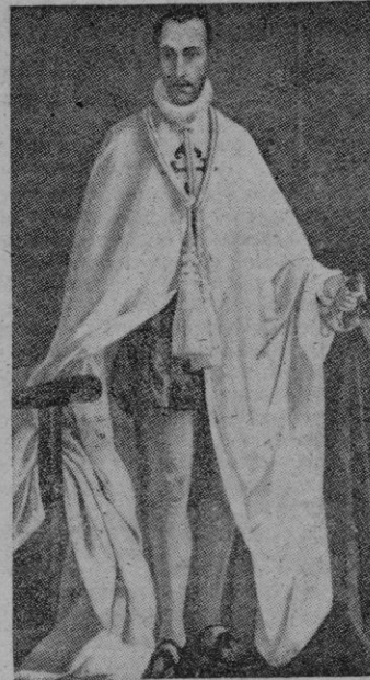
Retrato del Santo Duque de Gandia. Cuadro existente en el Salón de Coronas del Palacio Ducal. (Gandia)