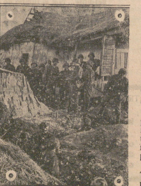
Granaderos alemanes que después de haber llegado hasta las líneas enemigas sacan a los bolcheviques que estaban escondidos en sus atrinchamientos.—(Foto «Presamundo»).

La meta señalada por Su Majestad Víctor Manuel no ha sido señalada de una manera pública, pero puede deducirse sin error cuál sea ante las acometidas que se lanzan contra él, y hasta contra la casa toda de Saboya, por la propaganda y por los periódicos enemigos.