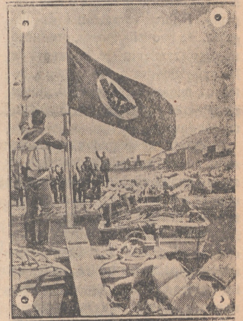
Un transporte sale al mar en busca de nuevos materiales para la construcción de barreras antitanques.

El Instituto Nacional de Previsión tiene para vosotros fórmulas de Seguro que os pueden interesar. Pedid informes en su Servicio Nacional de Seguros Libres.