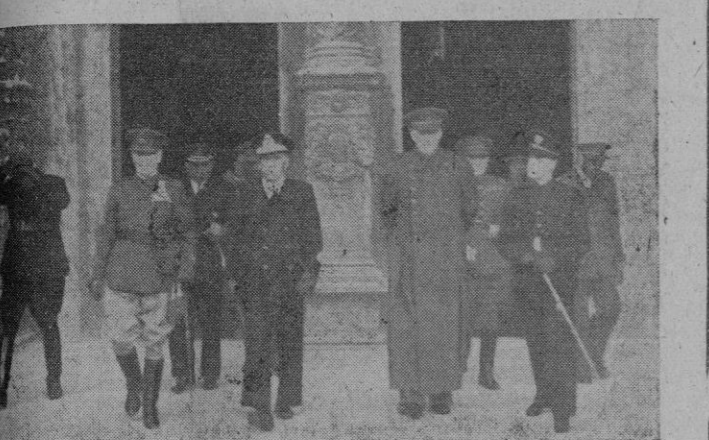
Las Autoridades al salir ayer de la Catedral terminados los funerales en sufragio de José Antonio.

En Alicante... Alicante. — A las 10 y media de la mañana, salió de la Plaza de Calvo Sotelo, una imponente formación de todos los Sindicatos al frente de la cual iban las jerarquías provinciales.