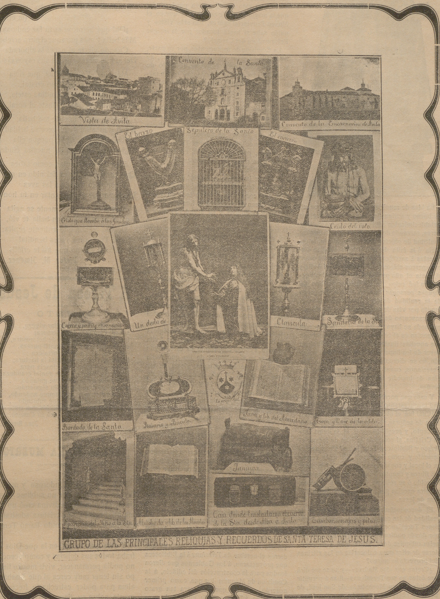
GRUPO DE LAS PRINCIPALES RELIQUIAS Y RECUERDOS DE SANTA TERESA DE JESUS.

Yo nací en Sevilla, ¡qué tierra más buena! Quiero á la Virgen de la Macarena. La de la Fuencisla me agrada también, (he visto á Segovia, en coche y en tren). Y como discurso por bastantes lados, á Valencia acuden los desamparados, ante cuya imagen imploran clemencia, para que ELLA siempre proteja á Valencia. Voy á Zaragoza, visito el Pilar, cantar quiero jotas y no se cantar. ¡Virgen de Begoña! que estás protegiendo la cuenca minera... ¡la que más me gusta, la que más me encanta! ¡Sois todas vosotras! al par que mi Santa. ¡Mi Santa bendita! la que está en el cielo, la Reformadora simpár del Carmelo. Paco Delgado.