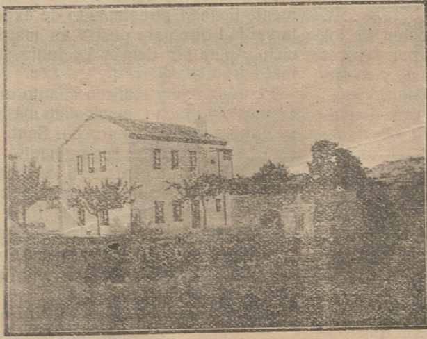
DIRECCIÓN Y OFICINAS