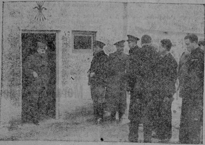
Madrid. — El Jefe del Estado, Generalísimo Franco, visita la barriada de casas para obreros que se construye en sustitución de las que fueron destruidas por la revolución marxista en la barriada de Usera.