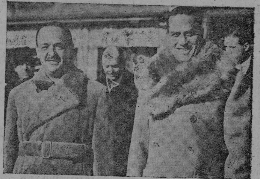
El Conde Csaky y el Conde Ciano al reunirse en Venecia para celebrar su primera conferencia

En las conversaciones de Venecia han llegado ambos ilustres hombres de Estado a una absoluta coincidencia en la apreciación del momento político por lo que afecta a ambos países.