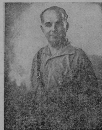
El General Varela

Solo en el primer día, que fué el sábado, quedaron en nuestro poder cerca de 30 kilómetros de extensión