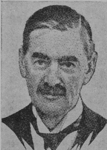
El "premier" inglés, Lord Chamberlain

realizadas. El acuerdo es exclusivamente comercial, si bien hay también en él varias cláusulas provisionales sobre la defensa de Irlanda y el pago de diversas anualidades de la deuda irlandesa.