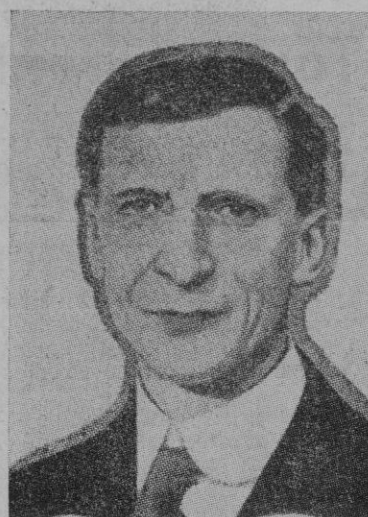
El Presidente irlandés, De Valera