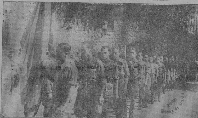
La ceremonia de la jura por los nuevos alféreces provisionales

Entonces su fachada de oriente, situada delante de la Catedral, no estaba anonadada como ocurre en nuestros días por el soberbio volumen del templo, ni presentaba un aspecto tan desnudo e irregular, elevándose a mayor altura sus tapias y sus tres torreones avanzados, se supone coronados tal vez de almenas y luciendo mejor entre ellos los dos arcos de entrada, que aún en los días actuales conservan su arabíga fisonomía. Entonces al Norte, en la parte de la cuesta de la Seo, se formaba un perimetro con torres, designándose la del ángulo Noroeste con el siniestro y trágico nombre de las Cabezas, por-