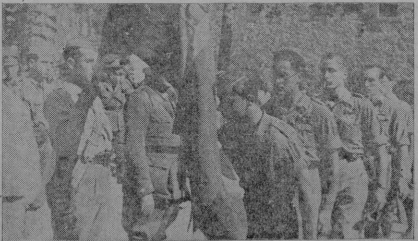
Un alférez en el momento de besar la bandera.