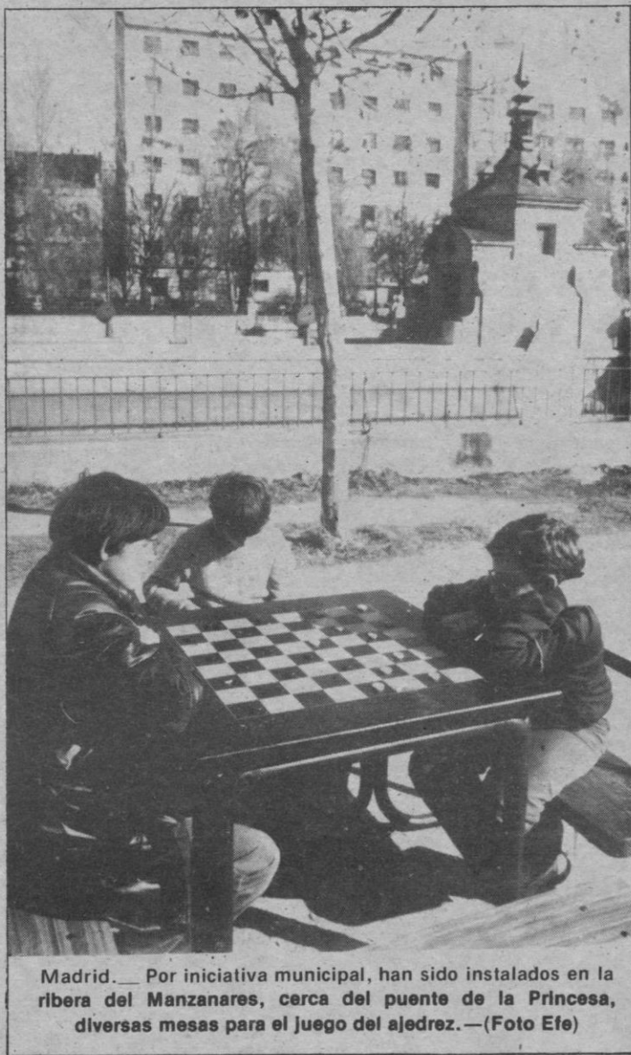
Madrid.— Por iniciativa municipal, han sido instalados en la ribera del Manzanares, cerca del puente de la Princesa, diversas mesas para el juego del ajedrez.

El fallecido vivía en San Sebastián, tenía tres hijos y era tío del conocido director de cine Elías Querejeta.—Efe.