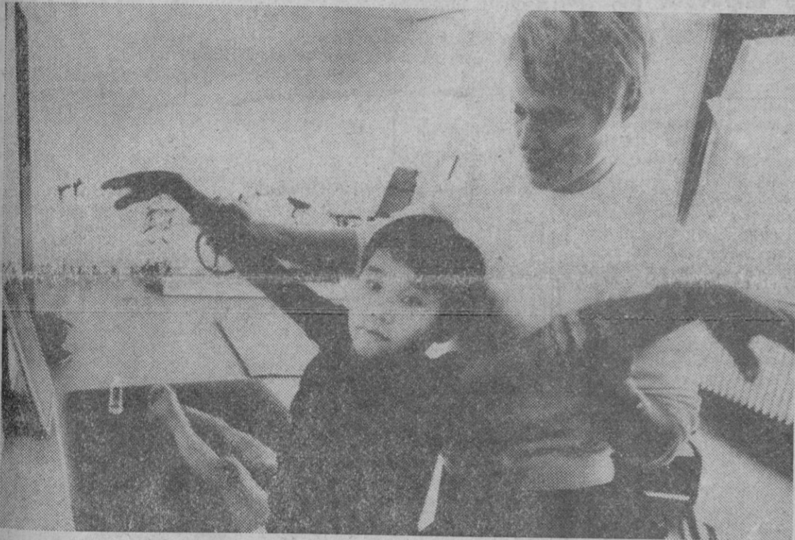
Bonn.—Un total de 150 niños de Vietnam del Sur, heridos en los disturbios de la guerra, fueron tratados en los últimos tres años por una institución que entretanto es considerada ejemplar en el mundo: en la Aldea de la Paz en Oberhausen, en la República Federal de Alemania. La aldea consiste en salas de operaciones y de tratamiento, en un centro de rehabilitación con piscina, una sala de gimnasia y un tanque para masajes subacuáticos en la foto una gimnasta terapéutica durante su trabajo.

Madrid, 12.—El Servicio Meteorológico Nacional informa que durante las próximas horas estará el cielo nublado con chubascos en el Cantábrico, cabeceras del Ebro y Duero y en Pirineos. Nieves en los sistemas montañosos de la mitad norte.