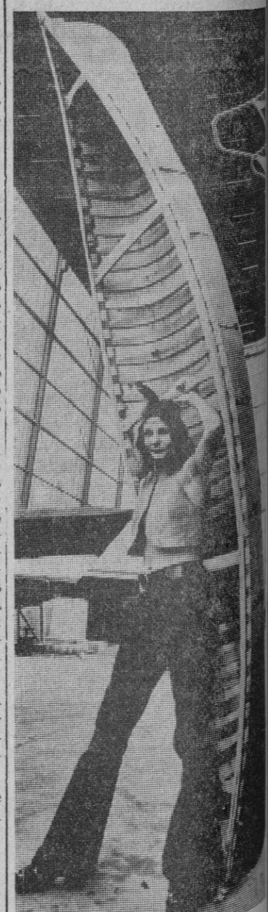
Hamburgo.—600 firmas procedentes de 24 países presentaron en la Feria Alemana de Botes Internacionales, recientemente celebrada en Hamburgo (RFA), mil botes de porte así como equipos y accesorios de la tribu de los algonquinos, de Ontario (Canadá), ha manufacturado esta canoa para un solo hombre, de 3,65 m. de largo y 18 kilos de peso, según la construcción tradicional de sus antepasados, de corteza de abedul y madera de cedro.

Logroño, 10.—A los noventa y tres años de edad ha fallecido en Logroño monseñor Fidel García Martínez, obispo dimisionario de la diócesis de Calahorra-La Calzada-Logroño, donde estuvo durante 32 años, desde 1921 a 1953, para ser sustituido por el actual prelado, doctor Abilio del Campo. El doctor Fidel García estaba considerado como el obispo más antiguo del actual Episcopado español y, muy probablemente, de todo el orbe católico.—Cifra.