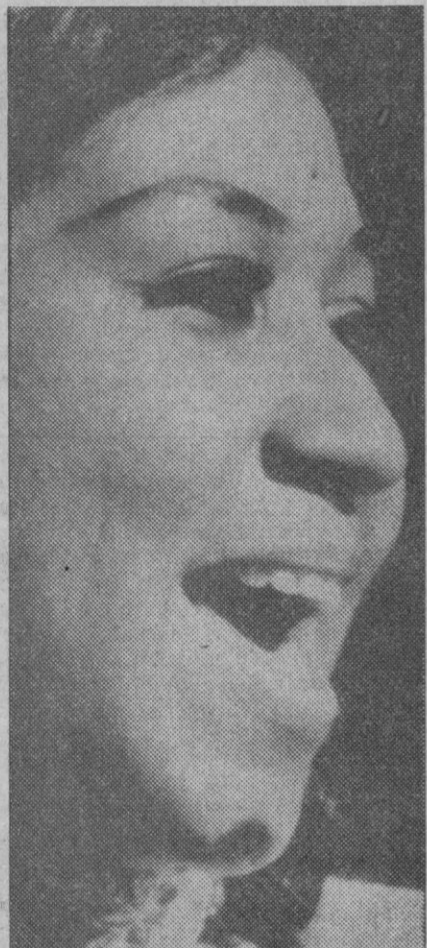
Aretha Franklin fue la mejor cantante de 1972

La sección Promo-Press se confecciona midiendo en centímetros