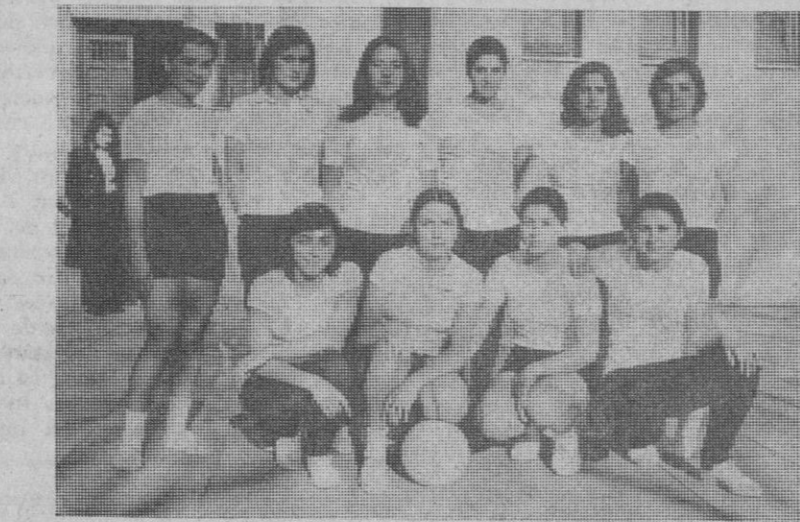
Equipo femenino de voleibol del Instituto A.—(Foto Antonio)

sistente dejó de escapar oportuni- dades de tiro, que a veces no se con- sumaron porque en los últimos minu- tos del encuentro, casi todos los ju- gadores de ambos equipos estuvieron dentro del área del Socuéllamos. Pese a todo esto, el equipo local, con Soto mandando en la defensa, elu- dió el peligro como pudo y logró consumir el minuto 90 con el resul- tado favorable, aun cuando fuera por la mínima.—Mencheta.