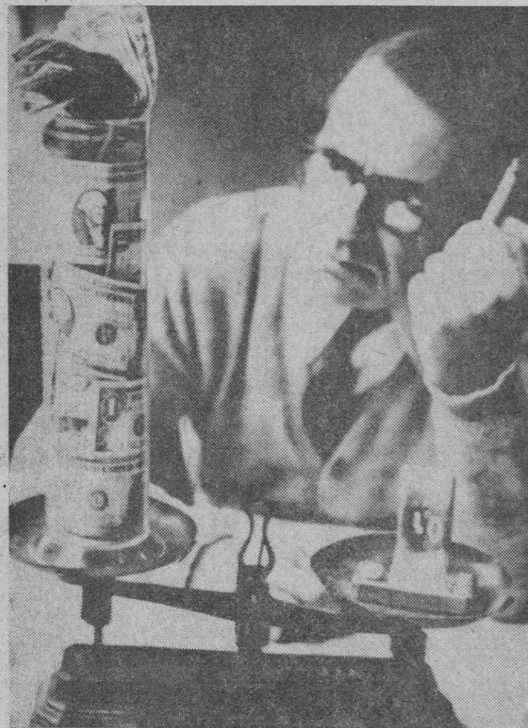
No cabe duda de que el oro pesa mucho más que el dólar, a pesar de la fiebre de compras que se ha registrado en la Bolsa de Nueva York, Japón, por su parte, ha cerrado el mercado de cambio exterior para evitar especulaciones.

Cerrados los mercados de cambio de monedas en Madrid, París, Londres y otras capitales