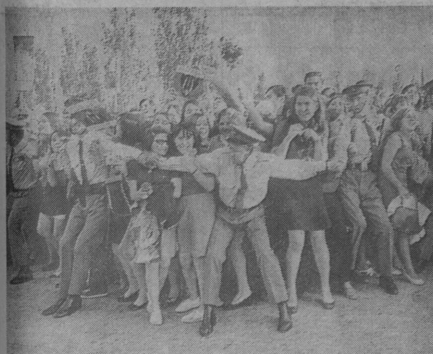
Madrid.—La fuerza pública contiene el «apasionamiento» de las «fans» que acudieron a Barajas a recibir Raphael a su regreso de América.

El espejo pesó 25 toneladas y es el mayor vidrio de una sola pieza construido en el mundo hasta la fecha.—Efe.