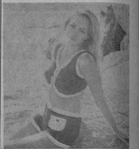
Traje de baño, compuesto de bolero y short, en rizo de algodón, color azul marino y blanco. Modelo Match. Francia.

ca de pimienta que se vierte sobre las judías. Luego se les agrega un huevo duro muy picadito y se revuelve cuidadosamente.