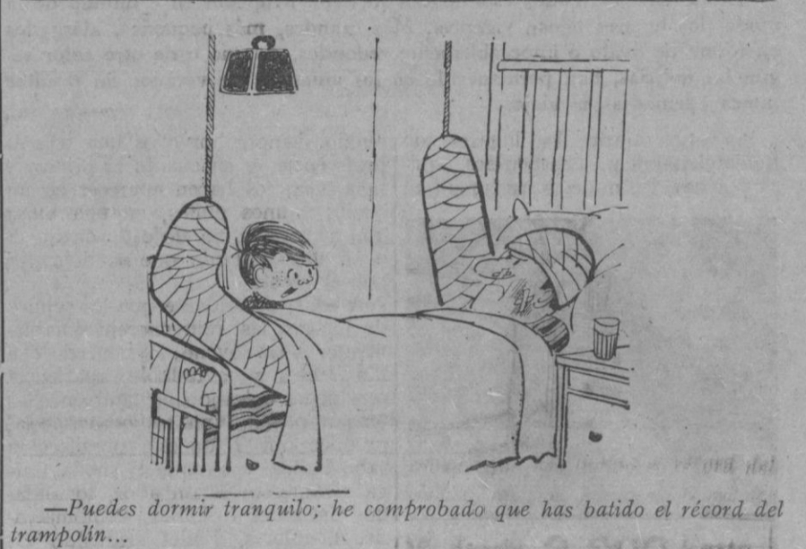
Puedes dormir tranquilo; he comprobado que has batido el récord del trampolín...