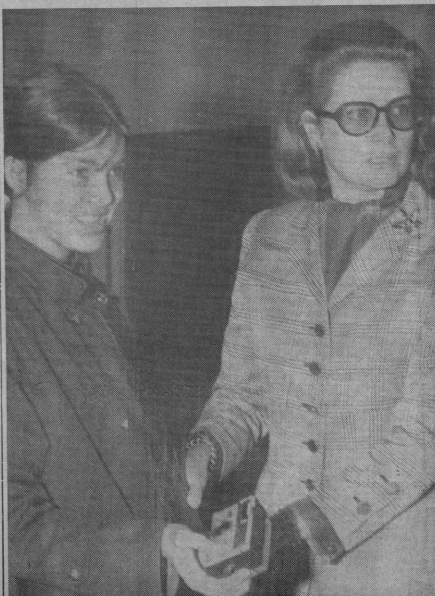
París.—En el aeropuerto de Orly vemos a la princesa Gracia de Mónaco con su hija Carolina momentos antes de emprender viaje hacia Estados Unidos donde pasarán las vacaciones.

El rectorado no ha contestado todavía a esta petición.—Cifra.