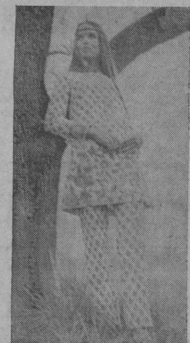
Este conjunto ha sido inspirado en los "hippies". Se compone de una túnica abotonada a la rusa y pantalón largo. Confeccionado en batista de algodón estampada con motivos florales. Modelo Sambo, Inglaterra